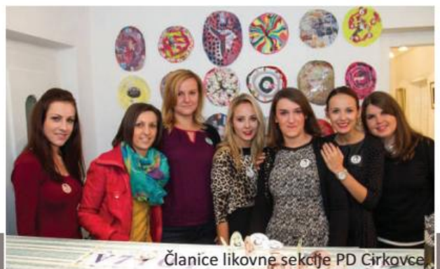
Članice likovne sekcije PD Cirkovce.