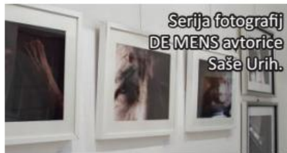
Serija fotografij DE MENS avtorice Saše Urih.

tudi solze na obraz. Zahvaljujemo se vsem sodelujočim in obiskovalcem. Obljubljamo, da bomo v Kulturni hiši tete Malčke še naprej ustvarjali program, ki bo povezoval in navdihoval ustvarjalce in udeležence. Hkrati napovedujemo niz dogodkov na Festivalu idej, ki bo potekal v mesecu decembru. Vabljeni, in da boste obveščeni, se nam pridružite na facebook-u – Festival idej.