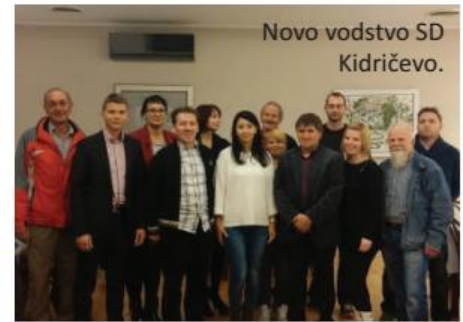
Novo vodstvo SD Kidričevo.

darstva, zagotovili bomo ugodne vire financiranja za nadaljevanje prestrukturiranja slovenskih gospodarskih družb in si prizadevali za zgraditev prve vetrne elektrarne v Sloveniji. Nadaljevali bomo projekt učinkovitega pobiranja davkov in boj proti korupciji.