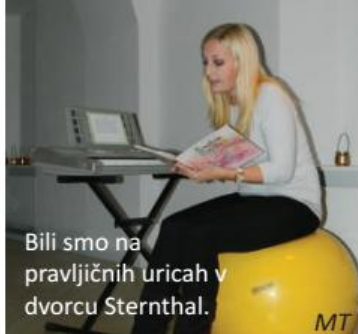
Bili smo na pravljčnih uricah v dvorcu Sternthal.