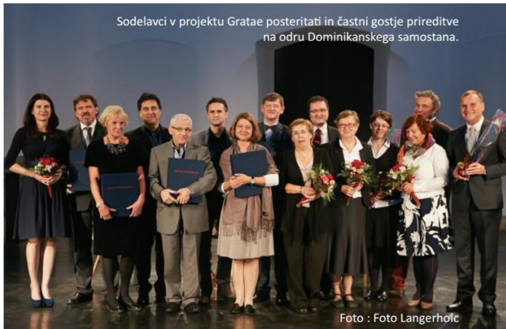
Sodelavci v projektu Gratae posteritati in častni gostje prireditve na odru Dominikanskega samostana.