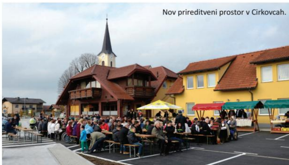
Nov prireditveni prostor v Cirkovcah.