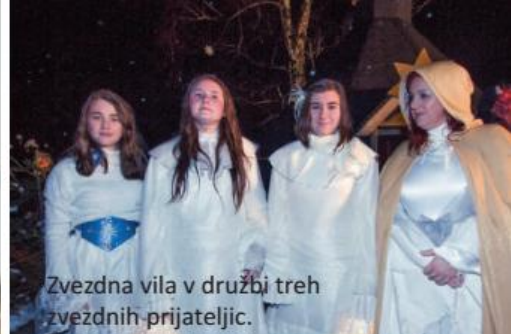
Zvezdna vila v družbi treh zvezdnh prijateljic.