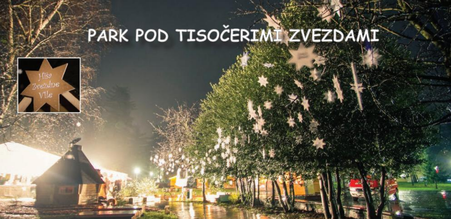
Zvezdna vila pred svojo hiško.