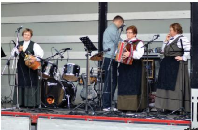
Tričlanska zasedba Veselih polank je odigrala nekaj skladb.