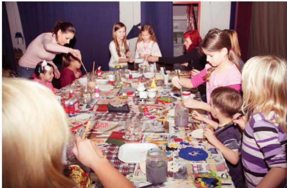
▲ Najmlajši so okraske poslikali in polepili z najrazličnejšimi božičnimi motivi.

Kulturna Hiša Tete Malčke