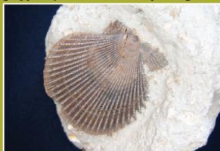
Fosil školjke v laporju iz Štrihovca.

Ste že obiskali geološko-paleontološki muzej v Dragonji vasi? Privatni muzej Pangea je odprt že 7 let, to obletnico je lastnik in kustos Vili Podgoršek tudi letos, tradicionalno v oktobru, obeležil z dnevom odprtih vrat in posaditvijo potomke najstarejše trte na svetu.