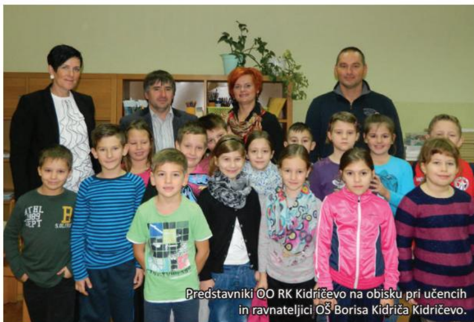
Predstavniki OO RK Kidričevo na obisku pri učencih in ravnateljici OŠ Borisa Kidriča Kidričevo.

Člani OO RK Kidričevo smo se letos odločili postaviti stojnico pred TC Jager v Kidričevem. Stojnico smo postavili v soboto, 18. oktobra. Od 9. do 12. ure smo mimoidočim brezplačno ponujali kruh in jabolka ter pečen kostanj. Kruh so donirale Ptujске pekarnе in slaščičarne. Jabolka so bila pripeljana iz RK Ptuj, pečen kostanj so nam darovali upokojenci DU Kidričevo. Zbrali smo 200 € donacijskih sredstev, ki smo jih že darovali OŠ Borisa Kidriča Kidričevo. Šola jih bo namensko uporabila za socialno šibke učence. Prav tako smo ob tej priložnosti predali OŠ Borisa Kidriča Kidričevo tudi nekaj