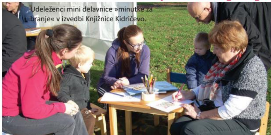
Udeleženci mini delavnice »minutke za branje« v izvedbi Knjižnice Kidričevo.

naše knjižnice, ki je bila namenjena tako otrokom in mladostnikom kot starejšim. Obiskovalci so prebrali knjige, literarno in likovno poustvarjali zgodbe in za konec si je vsak pobarval