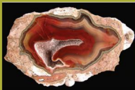
Mineral Kondor Ahat iz Argentine.