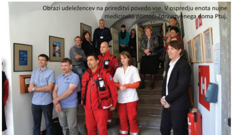
Obrazi udeležencev na prireditvi povedo vse. V ospredju enota nujne medicinske pomoči Zdravstvenega doma Ptuj.