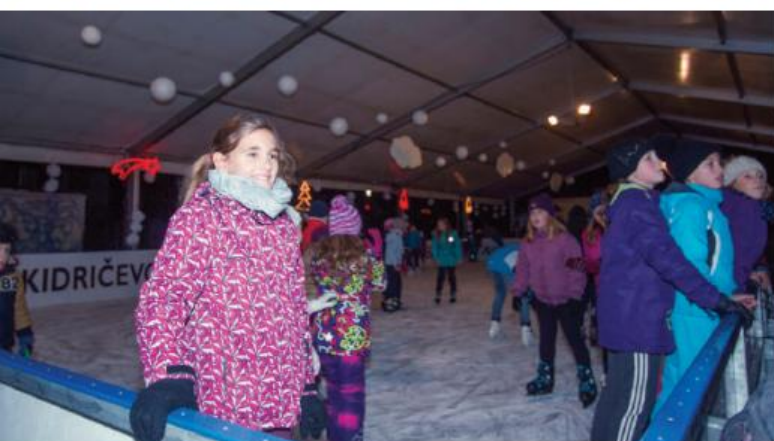
Tudi letos lahko drsamo na brezplačnem drsališču.