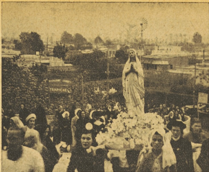
El 25 de Marzo se celebra en Eslovenia el "Día de la Madre" La Madre de Dios es en quién han de inspirarse todas las madres y todos los hijos. El amor desinteresado de las madres y el cariño casto de las que lo serán en Ella tienen su modelo.

In ti, ki čitaš te vrstice, kako vračaš ti ljubezen svoji Materi? Povrniva se v Njeno naročje.