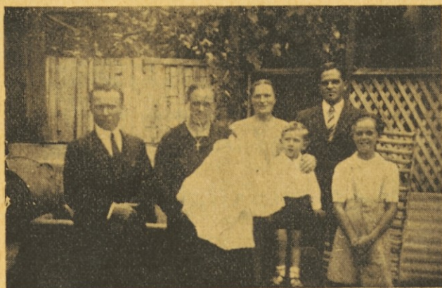
Globokarjeva Micka je prejšela sv. Krst.

Más también las fronteras del aún romano Nórico