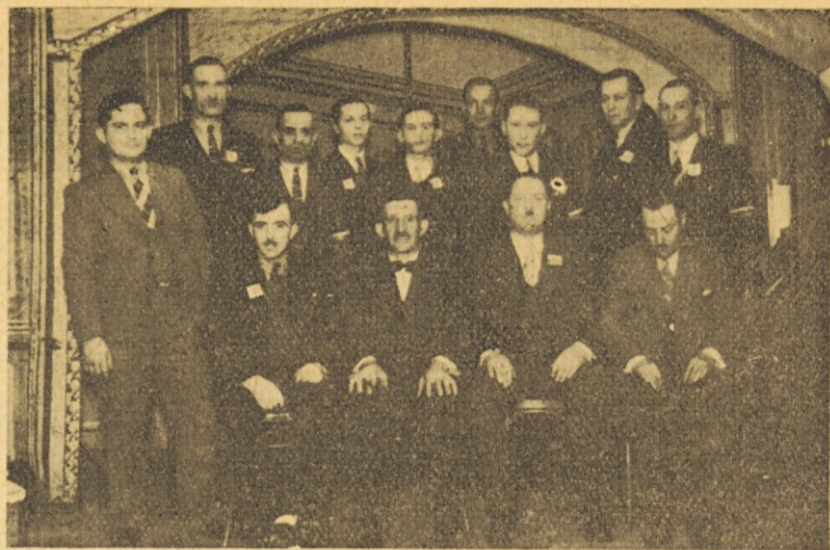
Odbor "Slovenske Krajine", ki je bil spet za eno leto izvoljen.

V zemljepisnem oziru je Grčija brez dvoma ena najzanimivejših dežel v Evropi. Med vsemi državami na svetu ima najčlenovitejšo obalo, vso razjedeno v polotoke in razkosano v večje in manjše otoke, ki so nanižani okoli nje kot prednje straže, ali na vzhodu kot na-