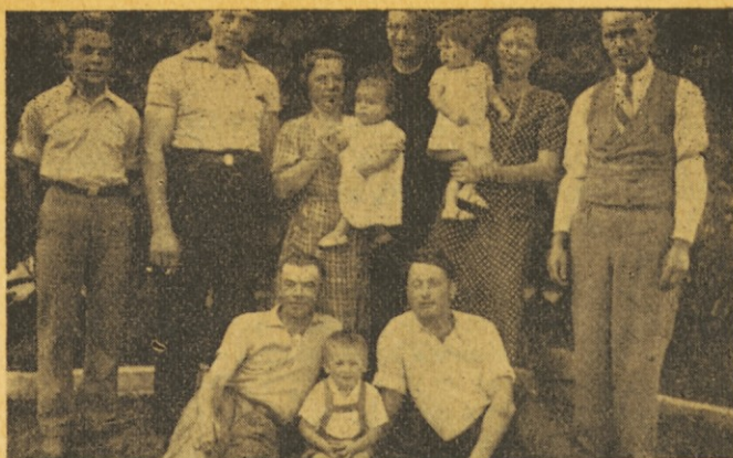
Nekateri obrazi iz Lome Negre

Naprej je dežela spet ravna. Na zanemarjenem polju se vidi, da je manj rodovitna. Širno polje zrele pšenice zastonj čaka žetve. Najbrže se ne splača delo, ker je klasje prav klaverno in sem komaj mogel dognati, kaj je bila setev, toliko je bilo plevela. Naprej pa že ni več obdelano polje. Bodisi da zato ne, ker ne donša,