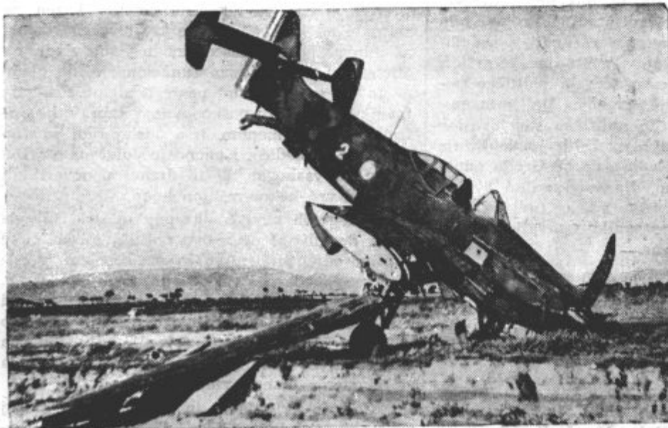
Sestreljeno letalo, ki se je pri padeu razbilo.

Najboljša obramba pred letali so letala. Protiletalska artilerija sicer nevarno ogroža sovražne pomete, vendar je njen učinek pri uničevanju sovražnih letal neprimerno manjši od lovskih letal.