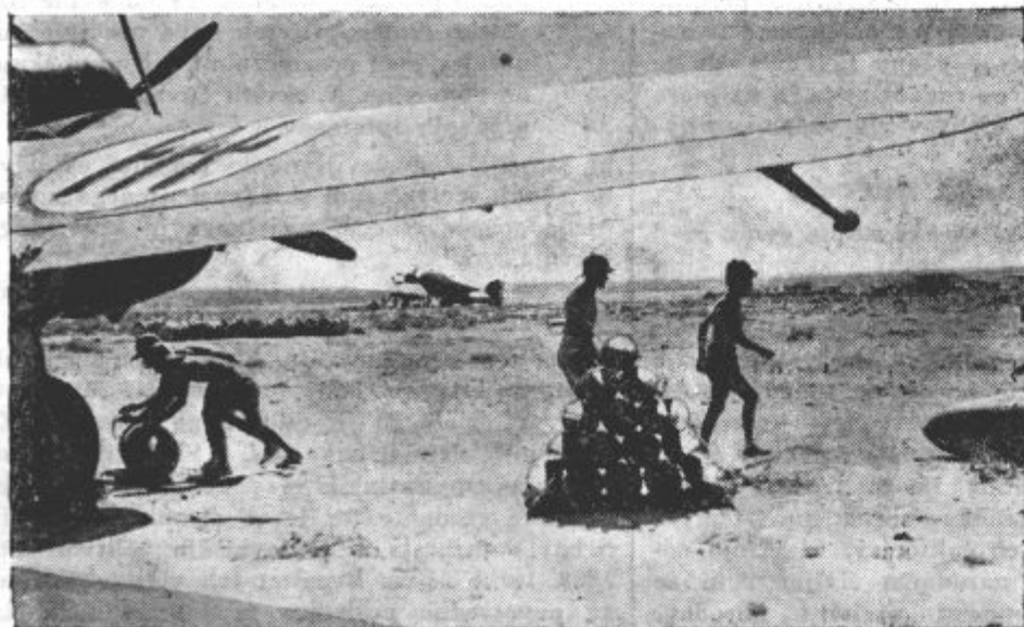
Bombno letalo v Afriki se pripravlja na polet. Vojaki pritrjujejo na letalo težke rušilne bombe. Angleško letalstvo se mora v veliki meri zahvaliti svojim uspehom dobremu letalstvu.

je razvidna iz tehle podatkov: 30. januarja je bila zavzeta Derna, 4. februarja Cirena, a 6. februarja se je udal Bengazi, čeprav je bil oddaljen nad 200 km.