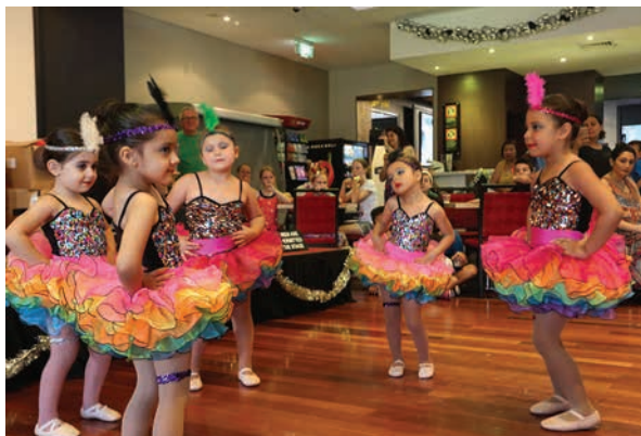
Najmlajši plesalci so vedno najbolj priljubljeni.