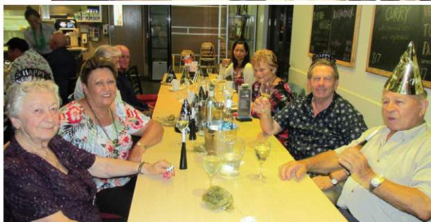
Prijatelji v pričakovanju leta 2019.

dvorana je bila rezervirana do zadnjega sedeža, na žalost pa se zgodi, da manjše število ljudi potem ne pride, saj jim ni bilo treba nič plačati in nekaj miz je ostalo praznih, potem ko smo jih proti koncu kar veliko odbili, da ni več prostora. Neodgovorni ljudje! Dvorana je bil lepo okrašena in ljudje so začeli prihajati zgodaj, da jim ni bilo treba čakati na večerjo.