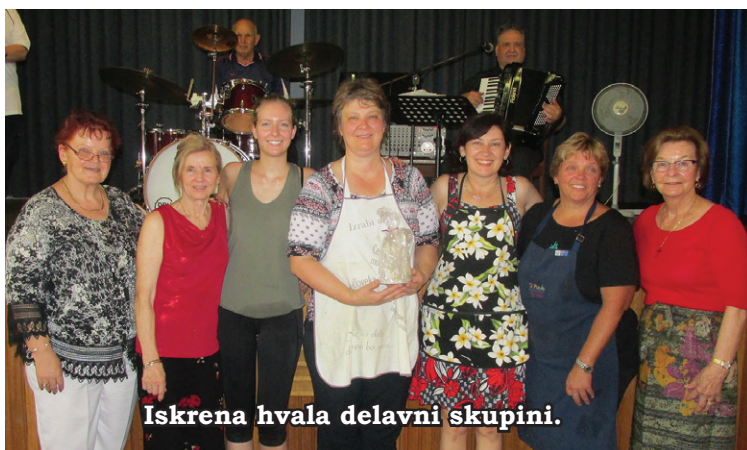
Iskrena hvala delavni skupini.