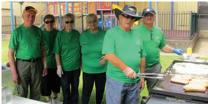
Klubske odbornike pripravljajo brezplačno kosilo za vse prijavljene otroke.