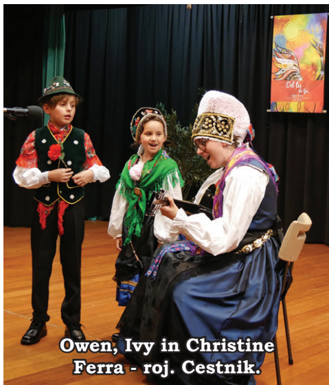
Owen, Ivy in Christine Ferra - roj. Cestnik.

SLOMŠKOVA ŠOLA bo začela s poukom v nedeljo, 17. februarja 2019 . Otroke in starše vabimo najprej k sveti maši