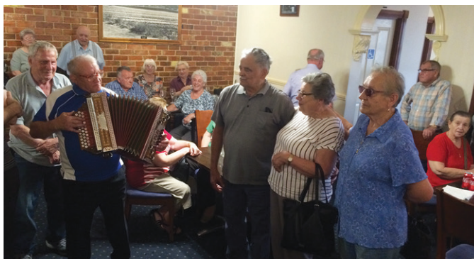
V restavraciji Back to Bacchus po kosilu.

Na tretjo adventno nedeljo, 16. decembra 2018, smo začeli z božično devetdnevnicco in po maši imeli družinsko kosilo, ki so ga pripravile članice