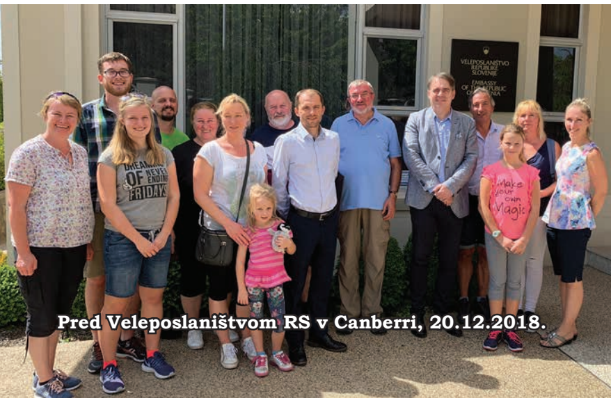
Pred Veleposlaništvom RS v Canberri, 20.12.2018.