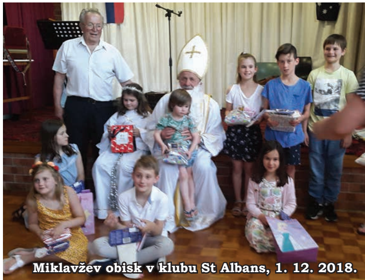
Miklavžev obisk v klubu St Albans, 1. 12. 2018.