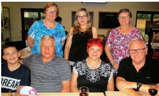
Cita in Katarina s sinom ter prijatelji.