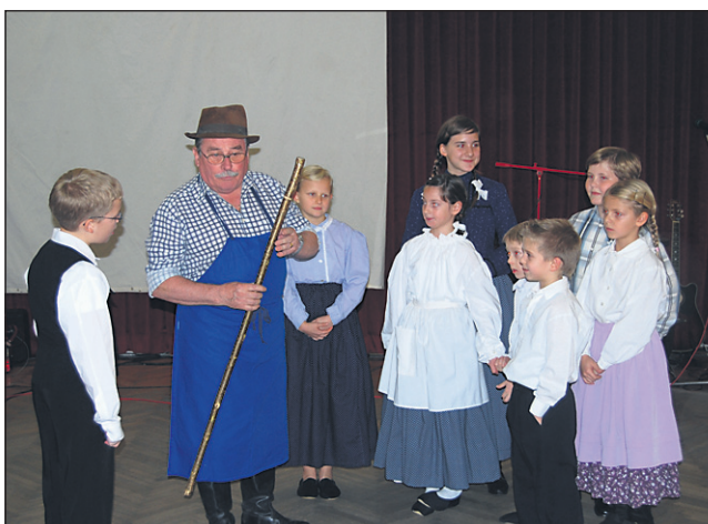
Program se je začel z nastopom najmlajših članov DPD Svoboda Ptuj, ki delujejo v folklorni skupini Klopotec.