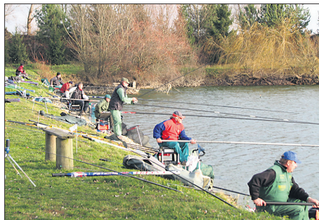
Na nedeljskem ribiškem tekmovanju v Dornavi so se daleč najbolje izkazali prav domačini, sicer gostitelji prvenstva; odnesli so namreč prav vse zmagovalne pokale.