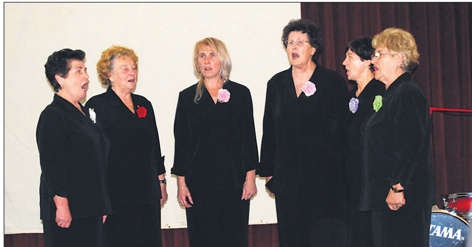
Zapele so tudi pevke Ptujске upokojenke.