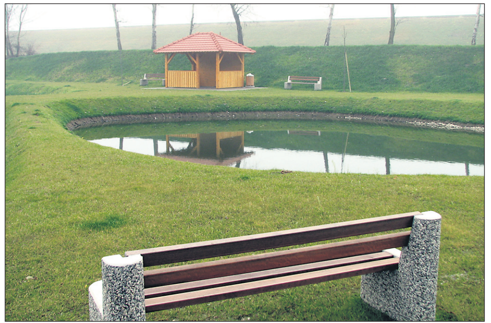
Doslej je bilo dokončanih pet projektov (štirje iz prvega in eden iz drugega razpisa), med njimi je tudi ureditev ribnika v Zabovcih (občina Markovci).

Zbrani na predstavitvi, ki je bila v četrtek dopoldne v prostorih Občine Markovci, so se sicer lahko še podrobno seznanili z vsebino in finančno izvedbo doslej potrjenih projektov. Na prvem razpisu v letu 2007 za izvedbo v letu 2008 je bilo za sofinanciranje v skupnem znesku slabih 80.000 evrov potrjenih sedem projektov, od katerih so štirje že dokončani, in sicer: projekt Od trte do vina nekoč in danes, nosilec projekta je Občina Destrnik, skupna vrednost je znašala dobrih 65.000 evrov, sofinancerski delež pa je bil 25.000 evrov. Do-