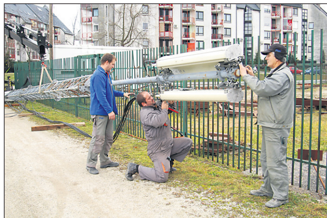
Začasno postavljeno anteno ob Volkmerjevi ulici so prejšnji četrtek po skoraj štirih letih odstranili.