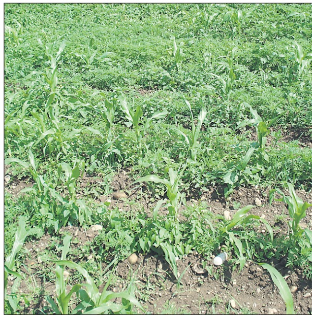
Pogled na njivo koruze na zaščitenem območju, kjer ni bilo uporabljeno nobeno škropivo: razrasel se je le plevel, med drugim ambrozija, ki velja za eno najbolj alergičnih rastlin na svetu.

Zaenkrat so njive zorane, vendar kmetje ne vedo, kaj zasejati. »Kam vodi takšna kmetijska politika in strategija, res ne vem. Veliko se vpije in govori o tem, kako je v Sloveniji samooskrba v nekaj letih padla s 70 na 50 %, po drugi strani pa se s takimi neživiljenjskimi uredbami in ekstremnimi prepovedmi, ki jih ne poznajo nikjer v Evropi, uničuje najboljša kmetijska zemlja. Kje je tu logika?! Režim, kot je predviden na