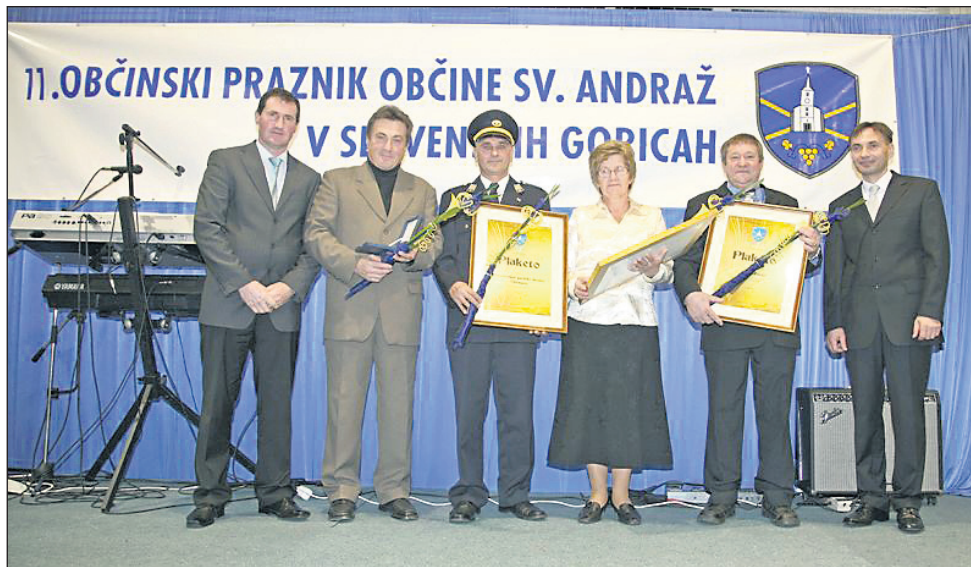
Prejemniki priznanj.

Stališče Direkcije RS za ceste pa sta po izčrpnih predstavitvah županov in Vurcer-