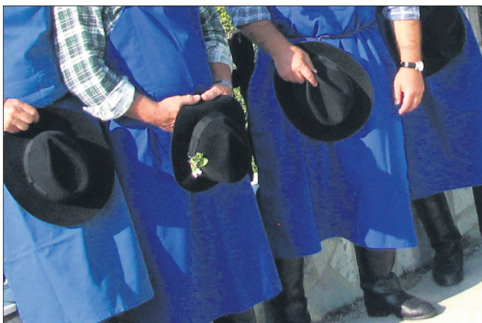
Cirkulanska lokalna politična smetana se je tudi na zadnji seji na vse mile viže »nategovala« okoli proračuna, na koncu pa je bil vendarle sprejet, čeprav le z enim glasom razlike ...

Tretja obravnava dobrih 3,5 milijona evrov težkega predloga proračuna pa se je tudi tokrat začela in lep čas nadaljevala tako, da je kazalo na ponovitev zgodbe »o nategovanju brez vrhunca«. Predlog proračuna je sicer doživel nekaj sprememb, predvsem v