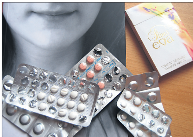
Varna droga ne obstaja.