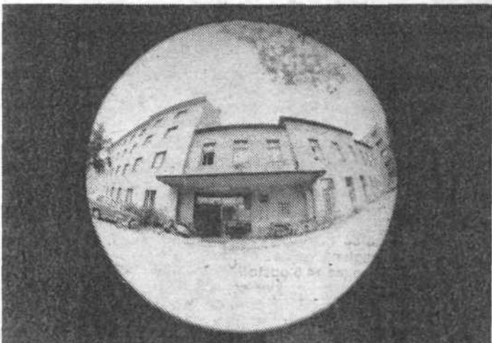
Družbenopolitične organizacije in svet delovne skupnosti Zavoda SRS za statistiko skušajo premakniti nekatere okorele oblike v delovanju ustanove, kjer je zaposlenih okrog 360 delavk in delavcev. Prepričani so, da bodo s spremembami zaustavili plaz odhajanja strokovnjakov z zavoda ter celo pridobili v svoje vrste mlade delavce s fakultetno izobrazbo.

Drugačen odnos do dela pričakujejo delavci Zavoda SRS za statistiko tudi zato, ker so v resnih škripcih. Računalnik z izjemnim procesorjem skoraj ne more sprejemati novih podatkov, ker je spomin zapolnjen z registrom, zavod pa nima deviz na nakup diskov. Točneje, diskov ne more kupiti tudi zato, ker temu nasprotujejo domači izdelovalci računalniške opreme. Kljub temu, da ne izdelujejo diskov, ki bi omogočali delo njihovem računalniku. Če bi imeli samostojna sredstva, bi se lažje izvili iz tega položaja, za katerega menijo, da ni na ravni stabilizacijskih prizadevanj naše družbe.