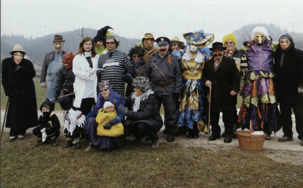
Pust Gaberški 2015.