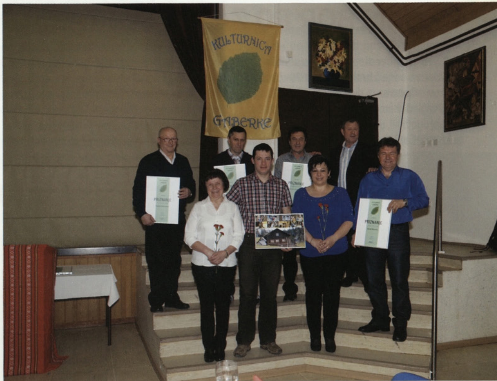
Občni zbor Kulturnica 2015.