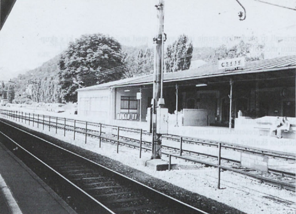
Celjska železniška postaja

S slaščinami smo ravnali racionalno, da bi jih lahko čim dalj časa uživali.