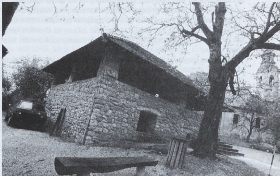
Komunistična partija je zgradila ločeno sredi dvorišča »grajsko ječo« - klet z debelim kamenjem, z malo lino, zastrto z okovanim železom.

Ta gospa ni nikoli videla notranjost cerkve, kakršno so nedotaknjeno pustili domobranci v maju leta 1945 ko so odšli.