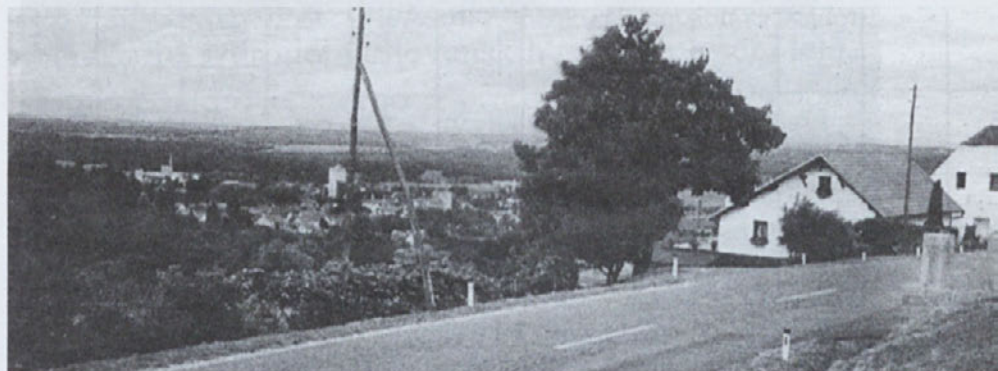
Severno mejo med Avstrijo in nekdanjo Jugoslavijo so po drugi svetovni vojni pogosto ilegalno prečkali pripadniki Matjaževega gibanja. Na posnetku je pogled iz slovenskogoriških Trat na avstrijsko stran.