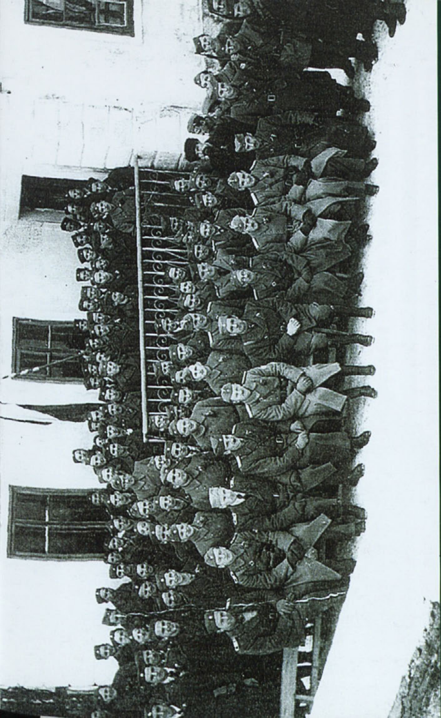
Protikomunistična vojska na Vrhniki