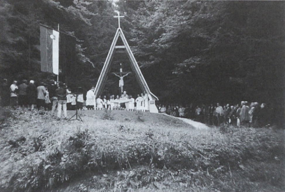
Kapela žrtvam komunizma v gozdu Marija Reka nad Trbovljami

Morilci so bili najeti Črnogorci in Hercegovci, da bi pokazali Hra- stničanom, kako se koljejo ljudje, predvsem pa otroci.