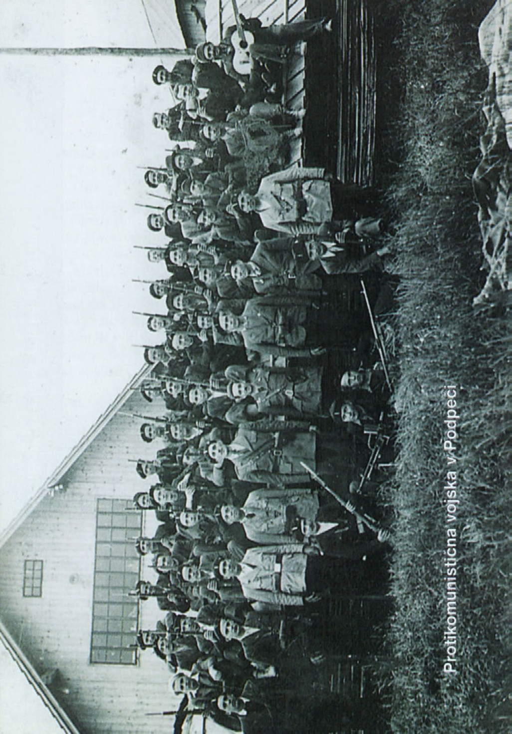
Protikomunistična vojska v Podpeči