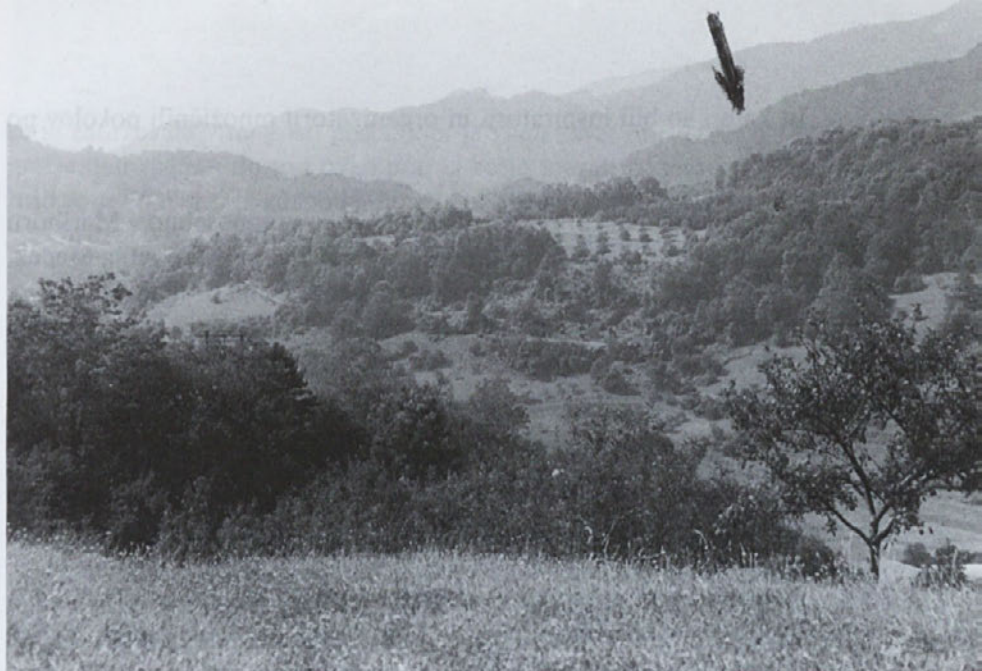
Hrastniški hrib »Tierberg«, grob domobrancev in civilistov.

na Pšenšeničniku ali v samem Kisovcu, Trboveljci na Zeleni trati, iznad Trbovelj, v smeri Zabukovja, Hrastničani pa v smeri Kala, v Senicetovi grapi, Tiebergu in Hudi jami. Ker jih je povsod tam ležalo že preveč, so jih začeli pokončavati tudi v Glembasovem pruhu, na Sv. Ani in ob Soški cesti v smeri Zidanega mostu. Nekatere od njih so pokončali tudi na Prodatovem posestvu, tik starega Soskega mosta in v Deželakovi grapi.