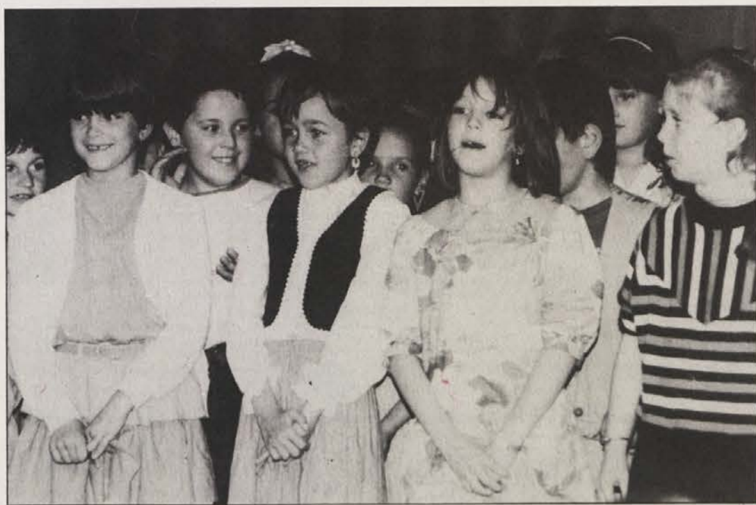
Oder v Bilčovsu je bil skoraj premajhen, toliko otrok je prišlo, da čestita materam za praznik