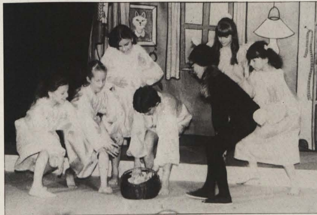
Otroci so bili veseli, ko jim je Muca copatarica vrnila pozapljene copate