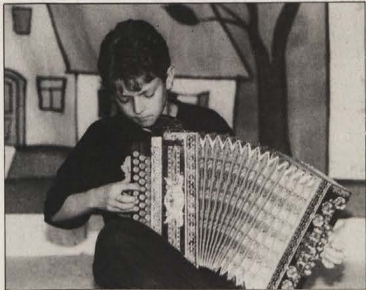
Pogumni harmonikar iz Šentjanža

Tudi materinska proslava, ki je bila v Bilčovsu, je povsem uspela tako s strani nastopajočih kot tudi obiska, kajti dvorana pri Miklavžu je bila nabito polna. Poleg domačega društvenega zbora in otroških skupin, je sodelovala tudi mladina bilčovske ljudske šole. Mamice (in tudi očetje) so bile za tako lep nastop mladih hvaležne in zelo počaščene.