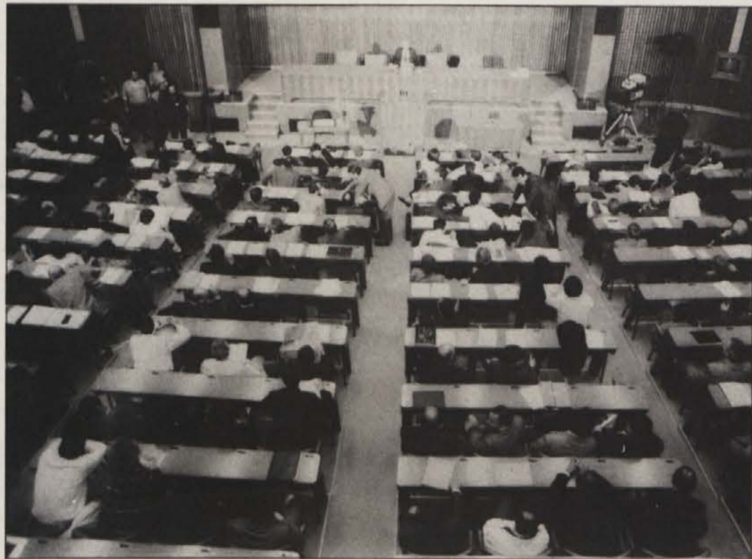
V novem slovenskem parlamentu je zastopanih devet različnih strank. Od teh jih je šest združenih v Demos, ki ima s 126 poslanci od skupno 240 absolutno večino, in si je poleg predsednika izglasoval tudi oba podpredsednika...