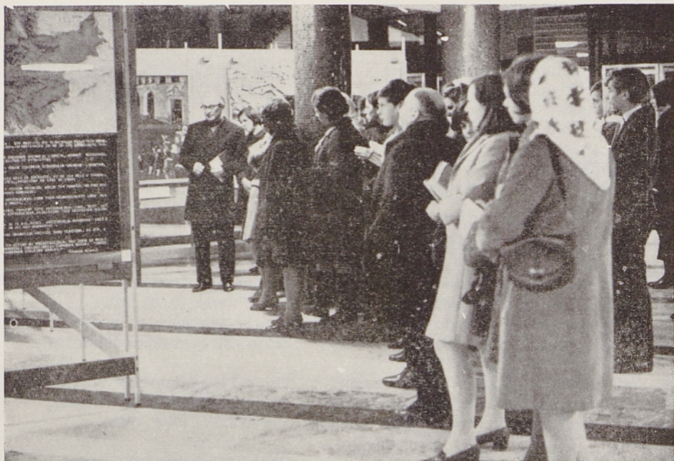
Slovenski dijaki si ogledujejo razstavo v Trstu