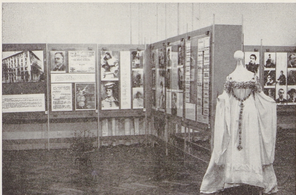
Nekaj pogledov na razstavo v ljubljanskem Narodnem muzeju