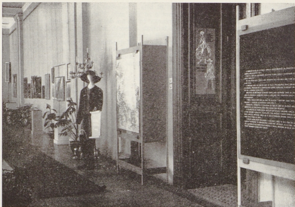
Nekaj pogledov na razstavo v ljubljanskem Narodnem muzeju