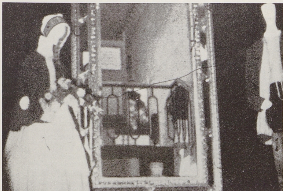
Z razstave v Celju (posnetek je z ozkega dokumentarnega filma, ki ga je posnel Peter Božič)