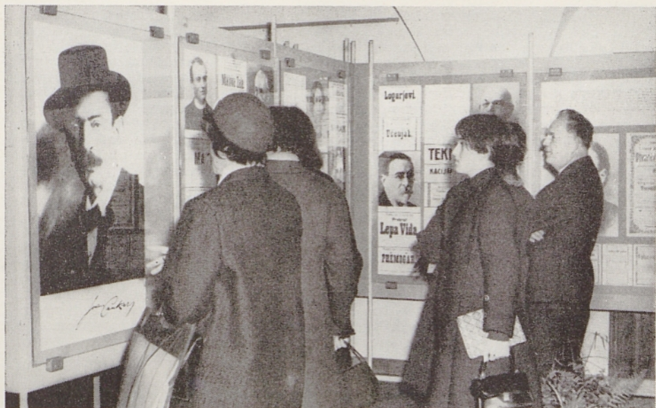
Pogled na del razstave v mariborskem Rotovžu