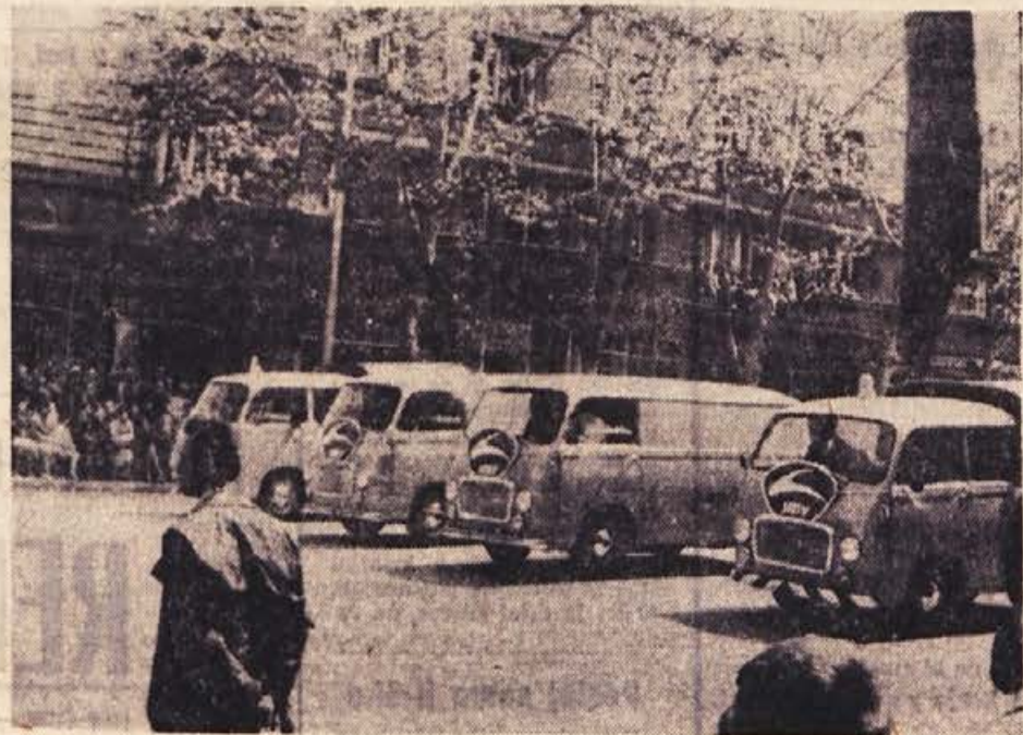
Na prvomajski paradi v Beogradu smo videli tudi osem avtomobilov novomeške INDUSTRIJE MOTORNIH VOZIL. — Na sliki: skupina kombijev, nekaj sto metrov pred glavno tribuno

• Britanski zunanji minister na Japonskem. Britanski minister Butler se je sestel v Tokiu z japonskim zunanjim ministrom Ohno. Ob tej priliki sta se sporazumela, da se ni nastopil pravi trenutok za japonsko posredovanje v sporu med Indonezijo in Malajzijo.