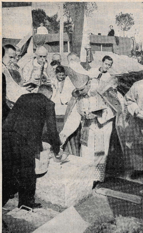
ZAGREB - KNEZIJA: Nadškof zazidava spominsko listino v temeljni kamen nove cerkve Marije Pomočnice.