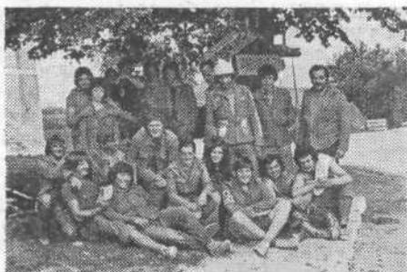
»Gasilski« posnetek šišenskih brigadirjev Brkini 75

Republiške mladinske delovne akcije, ki se jih lahko še udeležijo ljubljanska mladina: