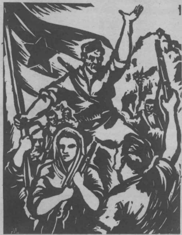
● OB DNEVU VSTAJE SLOVENSKEGA NARODA