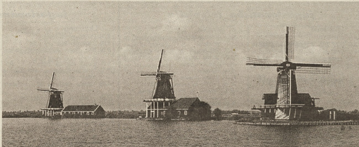
Značilni nizozemski mlini

Nizozemska je ena redkih držav, ki jih nismo še vključili v program naših potovanj po Evropi. To smo storili letos, tudi zato, ker so številni naši bralci že večkrat izrazili željo, da bi jih popeljali v holandsko glavno mesto Amsterdam.