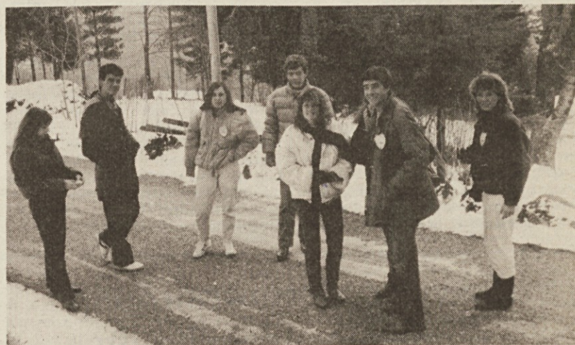
Z rahlo zamudo so prispeli »Argentinci« iz Entreriosa, Buenos Airesa in Rosaria