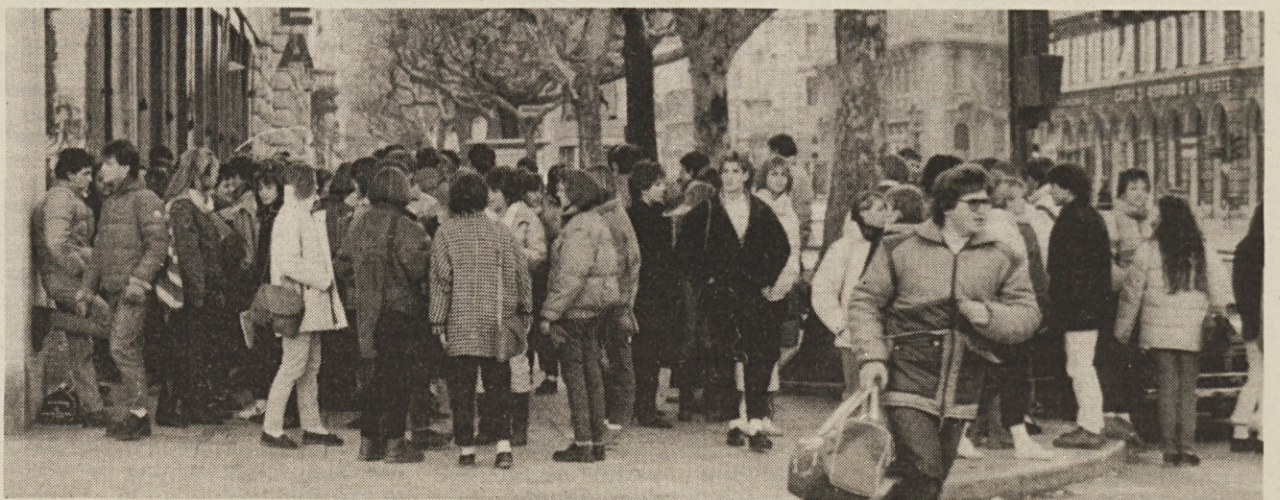
Najobičajnejše zbirališče mladih: na vogalu Trga Obendana