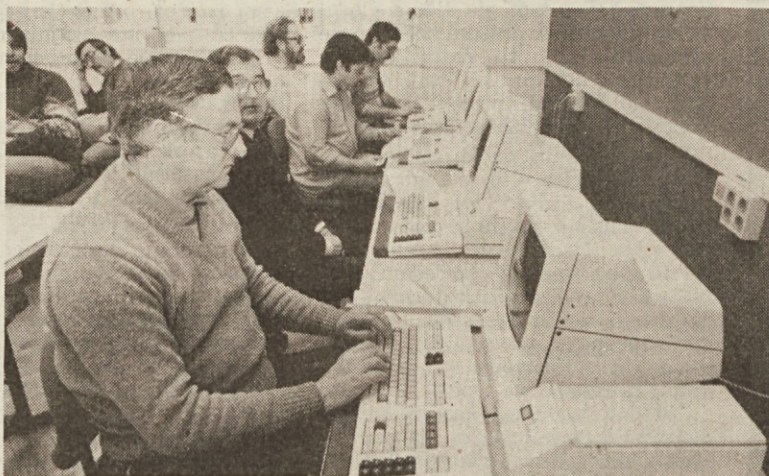
Takšna bo stavnica čez nekaj mesecev, do tedaj pa bodo uporabljali še vedno »stare« linotype

Sedaj smo lahko omejili izbiro na relativno