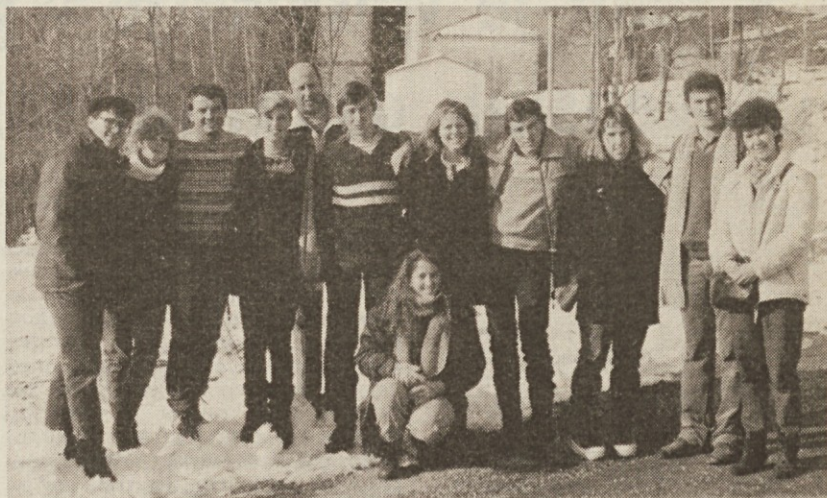
Avstralska skupina z gostitelji