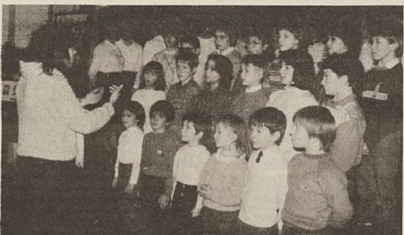
Nastop otroškega pevskega zbora med petkovo proslavo v Borštu

● Rajonski svet za Kolonjo in Škorkljo se bo sestel v petek, 17. januarja, ob 19. uri na sedežu v Ul. Cologna 30. Med drugim bo razpravljal o higienskem stanju Trga Volontari giuliani in Drevoreda 20. septembra.