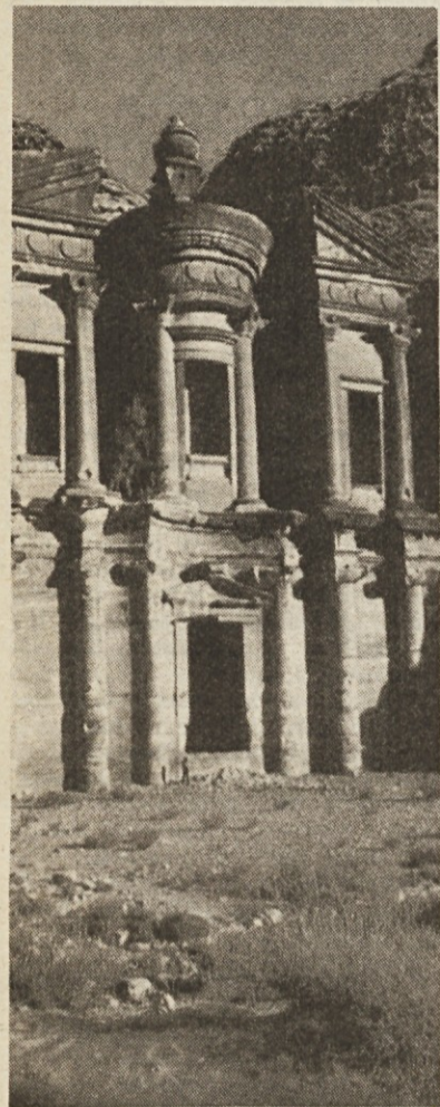
Pogled na Petro

Na koncu naj še omenimo, da je število prostorov na posameznih potovanjih omejeno, zaradi česar priporočamo našim bralcem, da z vpisovanjem pohitijo.