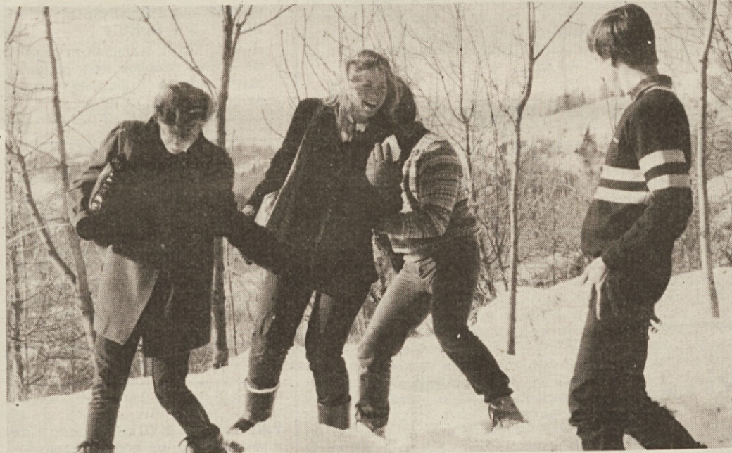
Posajenost na snegu in trenutek z našim dnevnikom v rokah