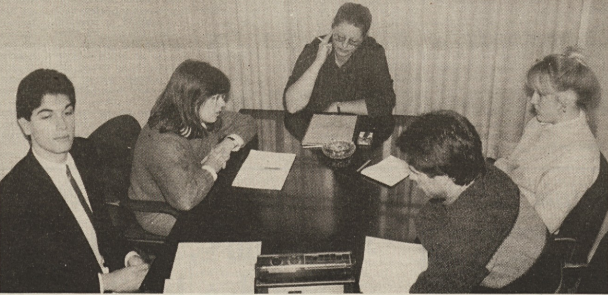
Udeleženci razgovora v naši redakciji