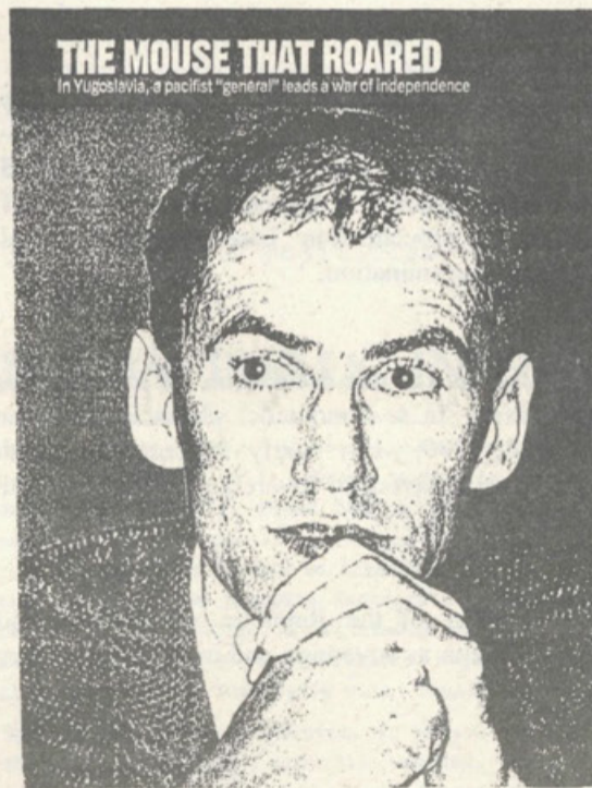
Pacifist-general Janez Jansa, originator moderne strategije.