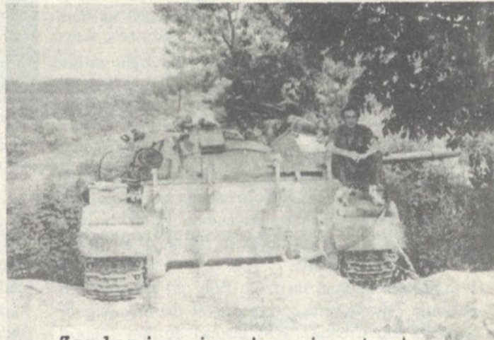
Zaplenjen in ohranjen tank.