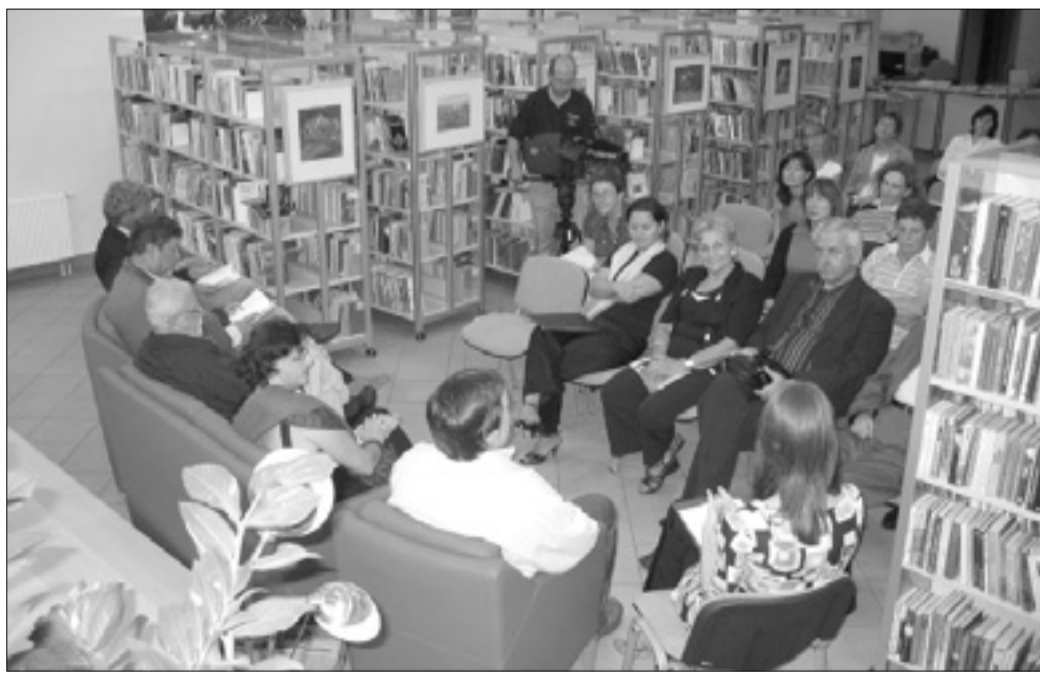
V divaški knjižnici so v četrtek pripravili zanimiv umetniško-literarni večer