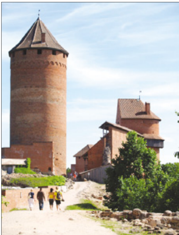
Levo grajski stolp v Siguldi; desno latvijska kmečka hišica v muzeju na prostem