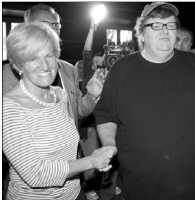
Ministrice za zdravstvo Livia Turco stiska roko Michaelu Mooru