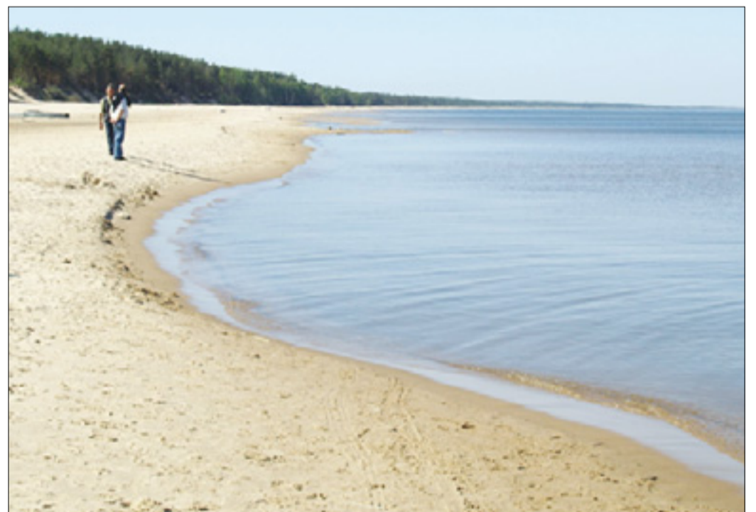
Zgoraj prekrasna dvorana v palači Rundale; spodaj plaža na Baltskem morju