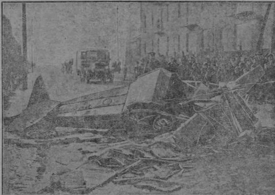
Najnovejše poljsko letalo je padlo iz zračnih višin na sredino ulice v Varšavi. Ubil se je vodja aeroplana in dva potnika, ki sta bila na ulici, sta bila smrtno nevarno poškodovana.

Tašča ima prvo besedo. Kakor je videti, so tožbe proti zlobnim in hudobnim taščam vsaj v Evropi nekoliko potihnile. Nekdaj ga ni bilo šaljivega lista, ki ne bi v vsaki številki povedal kakšne »mastne« na naslov tašč, danes so pa napadi na tašče precej ponehali. Mogoče pa je tudi to, da so se tašče poboljšale, ali pa je mladina tako pokvarjena, da se za tašče in njihovo govorjenje nič več ne zmeni. So pa še dežele, kjer je ostalo vse pri starem. Tako žive v Indiji še dandanes tašče, ki imajo prvo in zadnjo in glavno besedo v hiši, sinuhe pa ne smejo odpreti niti ust. Ko je nekoč stopil berač v neko indijsko hišo in prosil za milodar, mu je rekla sinaha: »Res nimam nič, da bi ti kaj dala.« Na te besede je berač odšel, a že pred hišo je srečal taščo. Povprašala ga je, zakaj je tako žalosten. Berač je povedal, da ni nič dobil. — »Tako?« je rekla tašča, »pojdi nazaj z menoj!« Ko sta prišla v stanovanje, je pa rekla tašča: »Tako torej, ta ti je re-