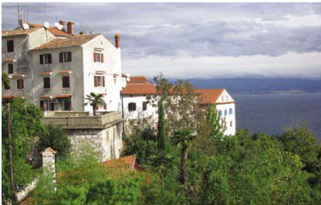
Mošćenice so strnjeno srednjeveško mesto, prislonjeno ob vrh hriba nad Mošćeničko Drago s širokim razgledom na Kvarnerski zaliv. Zunanji zidovi hiš na obrobju zamenjujejo mestno obzidje.

Mednarodna zasedba predavateljev in udeležencev konference iz vrst lokalnih, regionalnih in nacionalnih vladnih predstavnikov, strokovnjakov in raziskovalcev z institucij in nevladnih organizacij ter udeležba lokalnega prebivalstva ob vodstvu organizatorjev je ustvarila konstruktivno