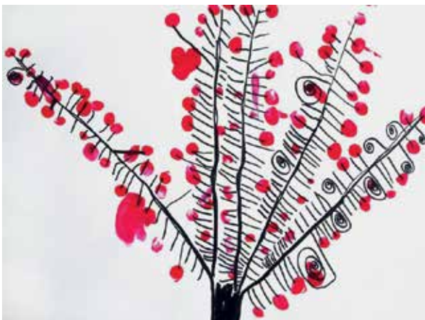
Slika 1: Šopkov grm 1, risba in odtisi s prsti

Če torej otrok samo posnema risbo odraslih, če ga pri tem popravljamo in mu vsiljujemo svoje rešitve, ga to zmede. Likovni izdelki odraslih so veliko preveč