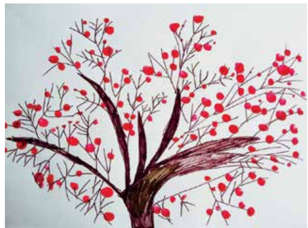
Slika 4: Šopkov grm 4, risba in odtisi s prsti