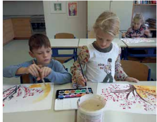
Slika 8: Slikanje z vodenimi barvami