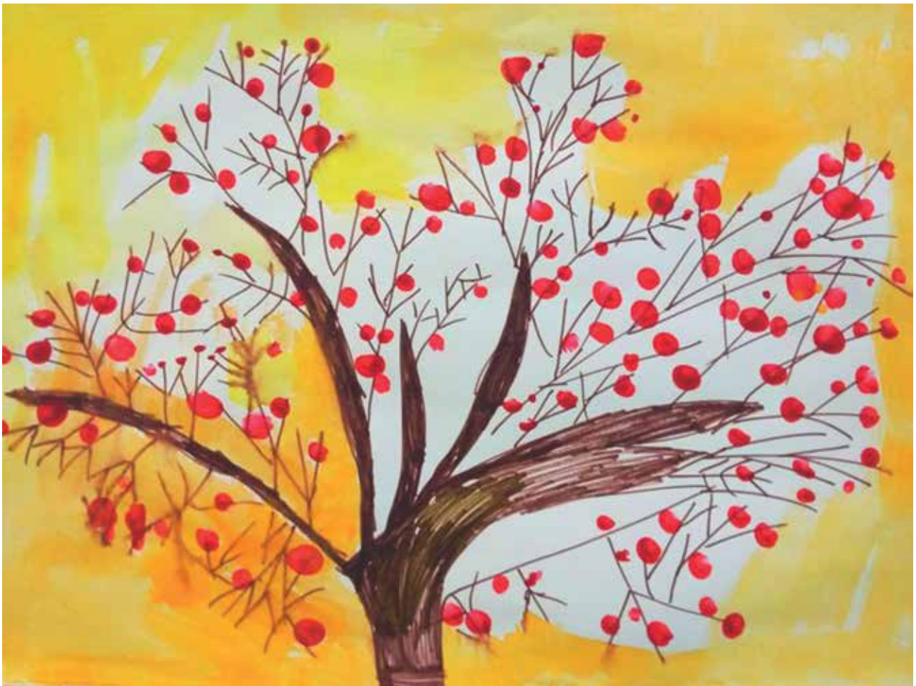
Slika 6: Šipkov grm 4 z odtisi prstov in vodenimi barvicami