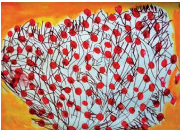
Slika 5: Šipkov grm 2 z odtisi prstov in vodenimi barvicami

In lahko ga predrugačimo, če se zavedamo, da se skozi risbo odraža otrokovo razmišljanje in čustvovanje, tudi njegovo razumevanje sveta (Jontes, 2007). Po Platonovo bi lahko rekli, da je lepo tisto, kar je dobro (in obratno). Kaj je torej dobro? To, da otrok pri risanju občuti svobodo in vznesenost nad ustvarjanjem in da je potem to potrjeno tudi s strani učitelja. Svoboda, igrivost in užitek so pomembni dejavniki pri ustvarjanju, tako odraslem kot otroškem (Kudielka, 2009). Kar ne pomeni, da otrok, ko je že sposoben ustvariti nekaj po načrtu, čečka brez cilja, šprica naokrog in packa po mili volji. Vseeno ga usmerjamo k likovni nalogi, vendar ne uničimo njegovega veselja ob nastajanju nečesa likovnega. Včasih naredimo več škode, če se vtikamo v otrokovo risanje ali slikanje, kot če mu pustimo, da zaorje v barve ali se zaplete v črte. Če vidimo, da je otrok