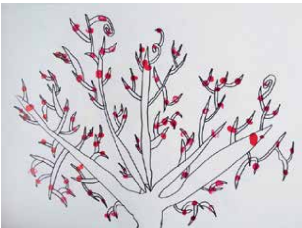
Slika 3: Šopkov grm 3, risba in odtisi s prsti