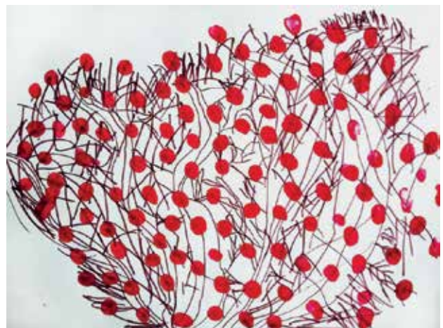
Slika 2: Šopkov grm 2, risba in odtisi s prsti