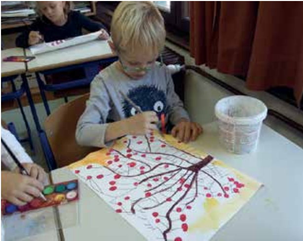
Slika 7: Slikanje ozadja