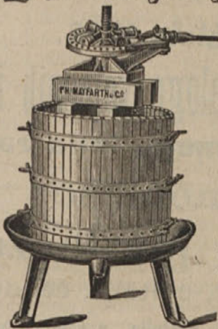
Stiskalnica za grozdje.

so naše „HERCULES“-stiskalnice najnoveje in najizvrstnejše mehanične sestave z dvojnatim, vedno delujočim pritiskalom; zagotavlja se skrajna vporabljenost, katera nadmašuje vse druge stiskalnice.