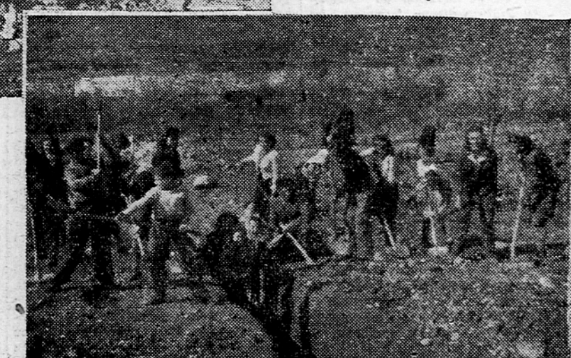
Zene in mladina iz Kanala ob Soči kopljejo temelje za dvorano zadružnega doma

Tako so se frontovci po vsej Sloveniji lotili del na gradiščih zadružnih domov, pripravljajo gradbeni material, sekajo les itd. Zivahno je bilo v nedeljo v Grižah, v okraju Celje-okolica, kjer so se pri skupnem delu znašli mladinci iz gradbene sole, vaščani in mladinski aktiv okrajnega magazina. Skupno so ta dan pripeljali na gradišče blizu 14.000 zidakov. Kmetje iz Vrbja pri Zalcu so pretekli teden vozili opeko z Ljubečne. Pripeljali so jo za svoj zadružni dom nad 5.000 kosov. Tudi druga gradišča ne zaostajajo. Krajevne uprave v Dramljah, Ljubčini in Trnovljah bodo same izdelale v poljskih opekarnah v Ljubečini in Blagovni potrebno jim opeko.