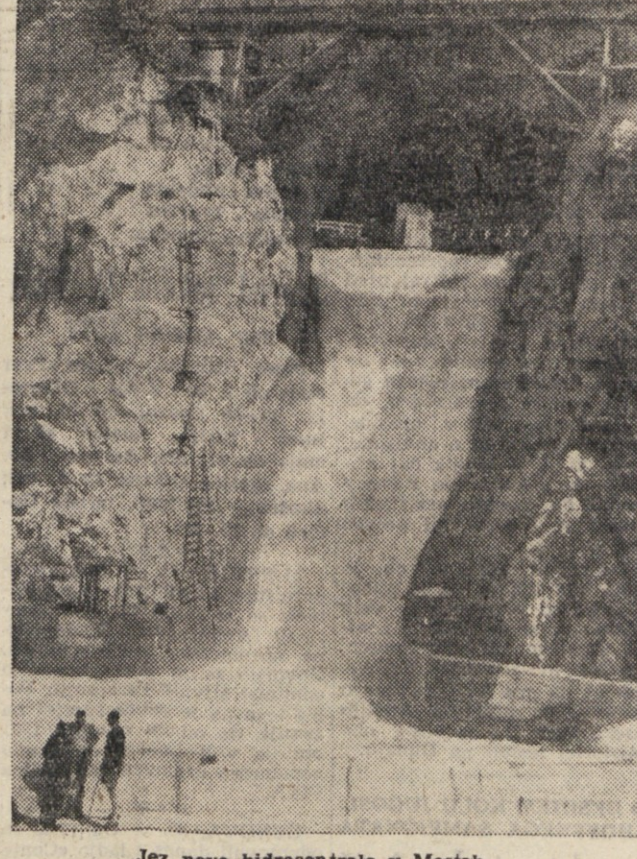
Jez nove hidrocentrale v Mosah.

Ko govorimo o elektrifikaci- ji seveda se smemo pozabiti, da je treba projektirati tudi omrežje daljnovodov z veliki- mi transformatorskimi postaja- mi. V «Elektroprojektu» ima- jo posebno delovno skupino za projektiranje daljnovodov in transformatorskih postaj, ki je v zadnjem času projektirala med drugim tudi visokonape- tostne daljnovode Javornik- Jesenice, Crnuče - Vevče, Cr- nuče - Brdo, Dravograd - Gustanj, veliko transformator- sko razdelilno postajo v Mari- boru ter industrijski transfor- matorski postaji v Gustanju in Storah. Podjetje «Elektropro- jekt» je že 1. novembra pre- šlo svoj letni plan za 8 odst., pri tem pa izrabilo kredite le v višini 61,5 odst. Vse to od- ra o veliki delovni zavesti pro- jektantov, ki so morali večkrat ustvariti načrte važnih objek- tov v najkrajšem roku, kar je še posebno težavno in od- govorno delo.