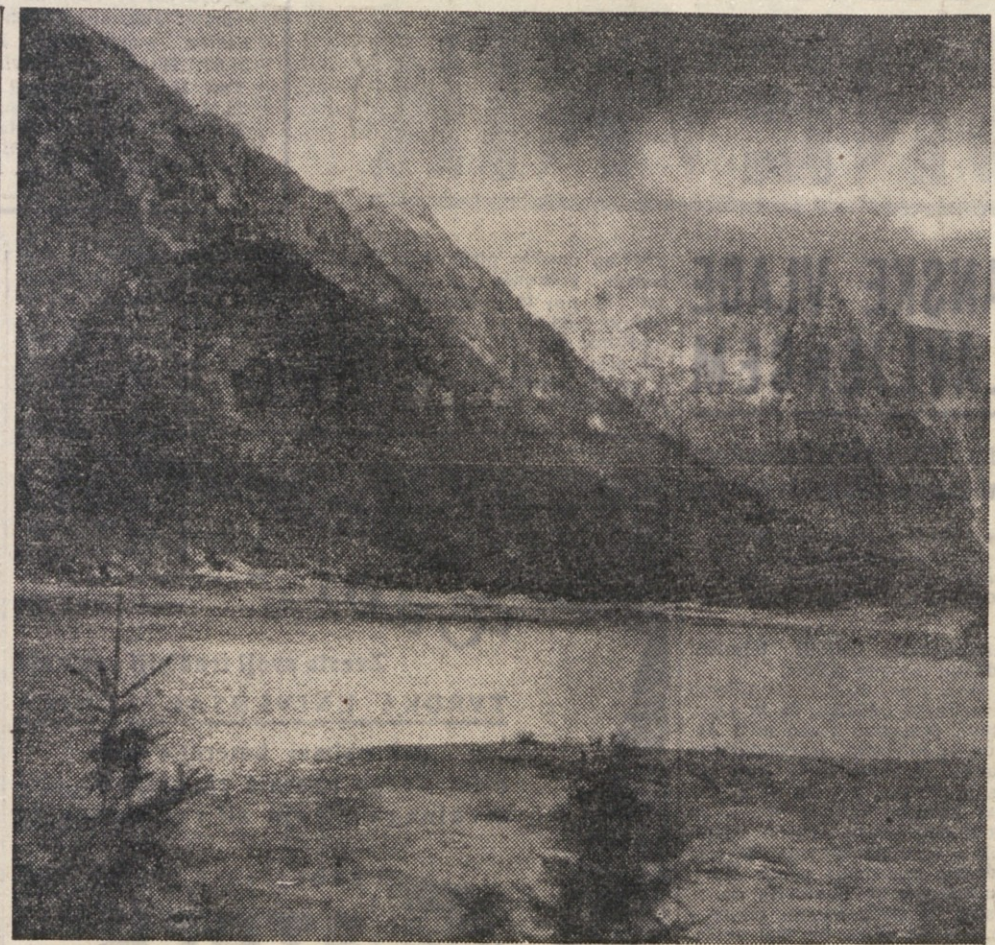
Pogled na Rabeljsko jezero, o katerem pravilica pravi, da je pri nastanku zalilo vas, v kateri je prebivalo približno in hudobno ljudstvo, ki ni hotelo sprejeti pod streho neke po- poinice. Motiv je S. Gregorčič obdelal v pesmi «Rabeljsko jezero».

Ze od nekadašnji slovenski prebivalci do danes so v Rabelju živeli v neposredni bližini znamenitega svinečnega valjaškega rudnika, ki je last nekakega videnskega škofa No- vora, in nekaj kilometrov proč od Rabeljskega jezera, ki ga je Simon Gregorčič zvekovček v svoji pesmi.