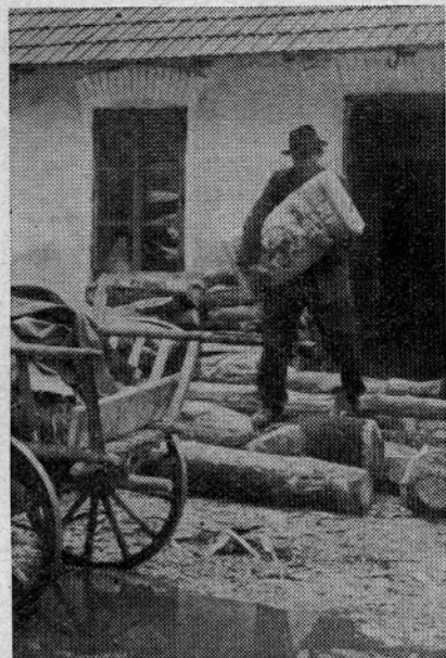
Če hoče dobiti kmet vreče z umetnimi gnojili iz zadrúžnega skladišča v Jurkloštru, že mora biti skoraj akrobat, da premaga ovire postavljene iz hlodovine