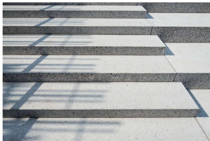
Stopnice – trg pod gradom, Škofja Loka, 2017