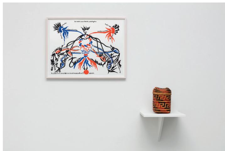
Risba Pletilec košar plete razlike in pripadajoča košara iz naravnih vlaken avtorice Marjetice Potrč.

oblikovalcev Slovenije je bila nekaj časa vodja unikatne sekcije. Z aktivnim delom in vključitvijo sodobnih zamisli je na področju oblikovanja tekstila odlično pripomogla k ohranitvi obrtnih znanj in slovenske kulturne dediščine.