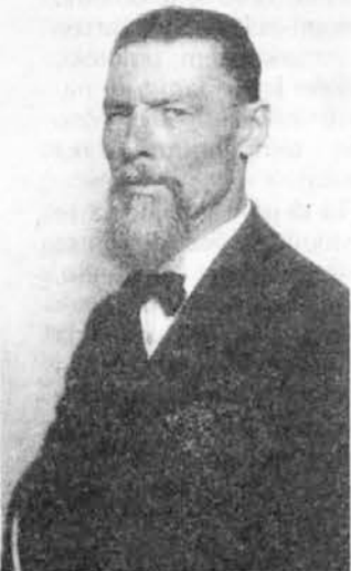
arh. Jože Plečnik (1872-1957)

Že sama misel na predstavitev opusa tega slovenskega kulturnega velikana v Bariločah brez pomoči iz Republike Slovenije se mi je zdela skoraj neizvedljiva in vsekakor tvegana, saj nimamo Slovenci v Argentini dovolj materiala, niti sredstev za minimalno kvalitetno razstavo vseh stvaritev in zamisli tega ne le slovenskega, temveč evropskega in svetovnega umetnika, ki je dobil svoje dolgo pričakovano priznanje in „poznanje“ šele v zadnjih desetletjih. Morda ne bi bila predrzna trditev, da je bil včasih Plečnik (1872-1957) bolj poznan v evropskem svetu kot v svoji lastni domovini.