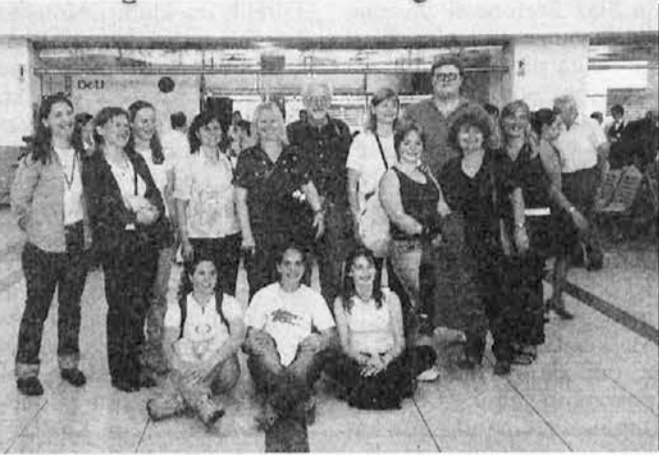
Na letališču Ezeiza pred odhodom

Diplomiranega novinarja bi poročanje s tako zamudo upravičeno živciralo. (To besedo smo večkrat slišali v