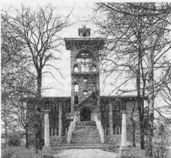
Cerkev sv. Mihaela na Barju, 1937-39

Nešteto razgovorov v Buenos Airesu in Ljubljani, kopica pisem in prošenj na Ministrstvo za kulturo, pa mnogo zagotovil, da bomo to razstavo mogli videti najprej v Buenos Airesu, nato pa še v drugih mestih Argentine in celo v Braziliji in Čilu, vse to me je navdajalo z optimizmom, ki mi je pa počasi kopnel, ko smo videli, da iz Ljubljane ni bilo razumevanja in je končno vse padlo v vodo.