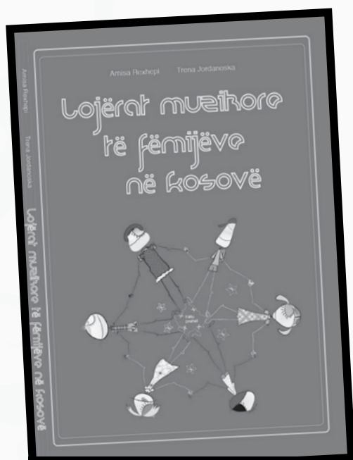
Slika 1: Knjiga Otroške glasbene igre na Kosovu , Arnisa Rexhepi in Trena Jordanoska, Albanološki inštitut, Priština, 2013

Ta prispevek predstavlja del naših teoretičnih spoznanj iz obdelave zbirke. V njegovi strukturi smo najprej izdelali pregled pomembnejših segmentov zgodovine arhiviranja otroških glasbenih iger. Sledi definicija in klasifikacija otroških glasbenih iger skozi prizmo glasbene vzgoje in glasbene folklore. Posebno poglavje je posvečeno procesu snemanja in shranjevanja video zbirke. Predstavljen je tudi proces zapisovanja igre, ki vključuje melografitiranje, opis načina igranja in ilustracijo igre. Na koncu so predstavljeni rezultati in sklepi, do kateri smo prišli z analiziranjem vzorca 100 glasbenih iger.