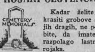
Postavljam in izdelajem vse vrste nagrobne spomenike v vseh naseljenih državah Illinois. Cene zmerne, delo jamčeno, posrežba solidna. Se priporočam!

Kadar želite o krasiti grobove svojih dragih, ne pozabite, da imate na razpolago lastnega rojaka.