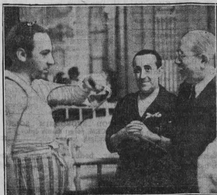
Na desni na sliki se vidi španski predsednik Azana, ki je obiskal ranjence v neki bolnici v Madridu.