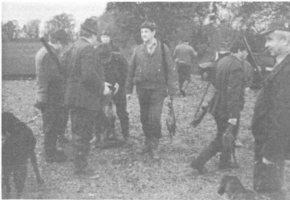
Barjanski lovci se zbirajo po končanem, to pot, uspešnem lovu. Letos je veliko fazanov.