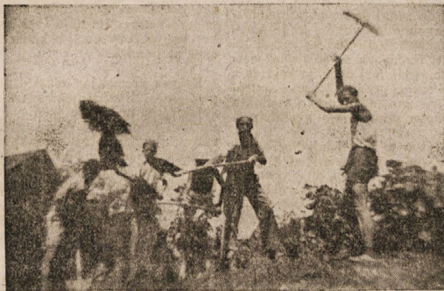
Mladina svobodne Jugoslavije gradi in ustvarja

Naša mladina je to že spoznala in se tesno strnila v Osvobodilni fronti. Tudi vnaprej bo ostala z njo tesno povezana, ker se zaveda, da bo samo v njej uresničila lahko svoje težnje in želje, ki jih naše ljudstvo že stoletja nosi v srcu. V bodoče bomo še v večji meri posvetili svoje sile trdni izgradnji naše organizacije, pa če bi se nam