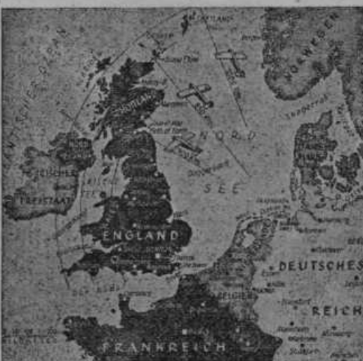
Pregledni zemljevid pokrajin v Severnem morju, katere bombardirajo nemška letala iz svojih oporišč. Anglesko otočje je v letalskem območju Nemčije.