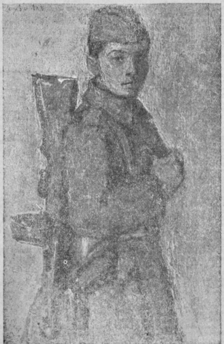
Akad. slikar Ljubomir Lah: Vojak s avtomatsko puško (olje)

V teh bojih je brigada uničila nad 1700 Nemcev, 700 Bolgarov, 300 ustašev in okoli 1000 četnikov. Izgube sovražnika s strani borcev te brigade povečuje še okoli 4000 ranjenih in velikanske množine zaplenjenega vojnega materiala. Po vojni je brigada čuvala zahodne meje Slovenije, kasneje tudi severno mejo, dokler ni končno dobila v Celju svoje stalno mesto.