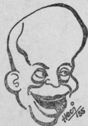
Predsednik ZDA Eisenhower