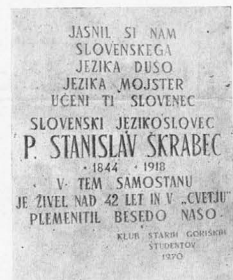
Spomenka plošča, posvečena o. Stanislavu Škrabcu v samostanu na Kostanjevici pri Gorici