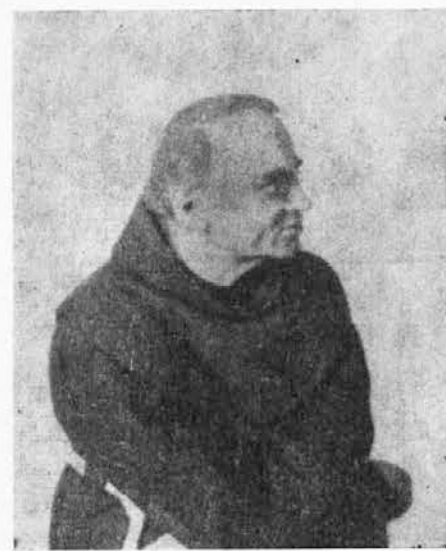
O. Stanislav Škrabec, slov. jezikoslovec

Jasnili si nam slovenskega jezika dušo, ga v »Cvetju« bistrili, brusili in krepili, odkrivali nam njegovo si lepoto, ljubiti ga si vztrajno nas učil jezika mojster, učeni ti Slovenec.