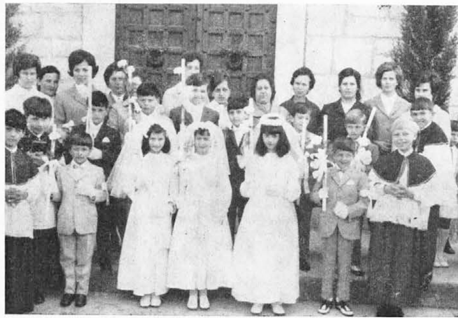
Srečni obrazi otrok v Doberdobu, ki so 24. maja letos prejeli prvo sveto obhajilo. Po sklepu italijanske škofovske konference (CEI) bodo otroci v Italiji prejeli sv. obhajilo ob koncu tretjega razreda ljudske šole