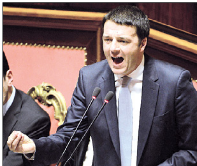
Predsednik vlade Matteo Renzi včeraj v senatu

Medtem je včeraj v javnost prišla vest, da Silvio Berlusconi ne več na seznamu Vitezov dela. Vodstvo federacije vitezov je zaključilo z oceno Berlusconijevega položaja po obsodbi, vendar je on sam pred sklepom vodstva poslal pismo, s katerim se je avtosuspendiral iz združenja.