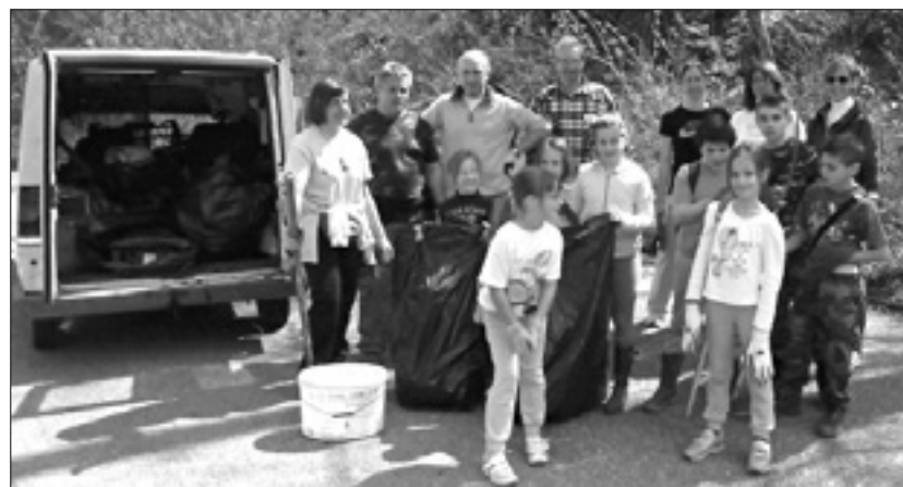
Udeleženci lanske čistilne akcije in del nabranih odpadkov

Odpadke bodo pobirali ob Vipavi in Soči - Ribiči prirejajo tudi tekmovanje za najboljšo salamo