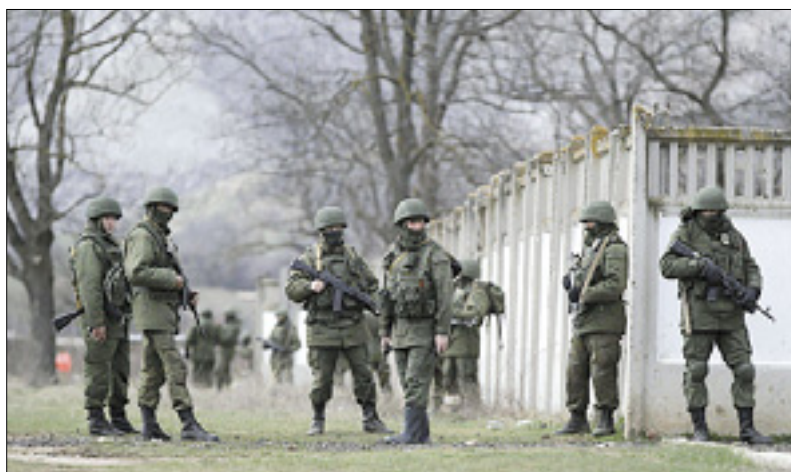
Ruski vojaki pred obkoljeno ukrajinsko vojašnico na Krimu

Poleg tega pripravlja Ukrajina načrt za umik svojih vojakov s Krima, je povedal prvi mož ukrajinskega nacionalnega sveta za obrambo Andrij Parubij. Krimski premier Sergej Aksjonov pa je medtem zagotovil, da bodo tamkajšnje oblasti ukrajinskim vojakom, ki bodo želeli Krim zapustiti, omogočile varen umik, če bodo spoštovali postavljene pogoje. »Pripravljamo načrt, v