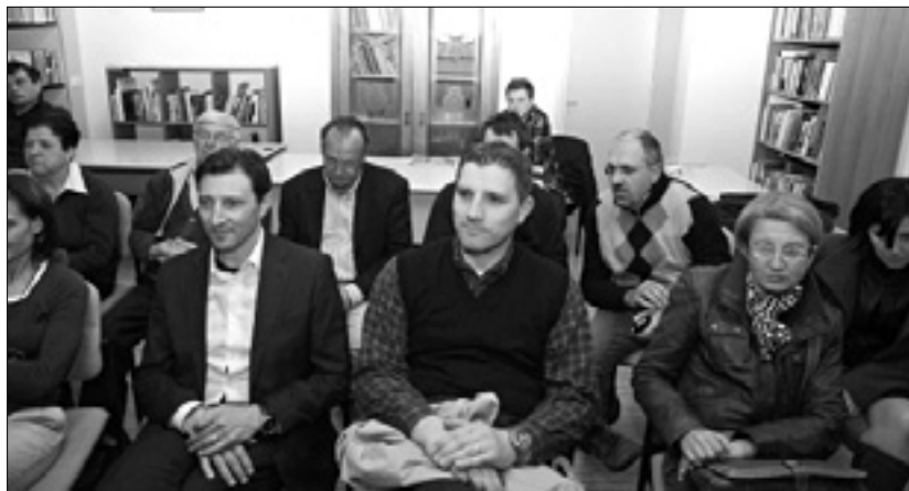
Udeleženci srečanja v Feiglovi knjižnici