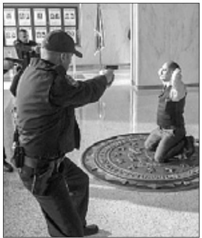
21.15 Film: Črni seznam