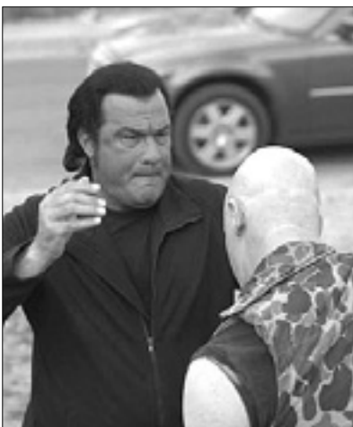
21.15 Film: Urban Justice – Città violenta 23.15 Serija: The Chase