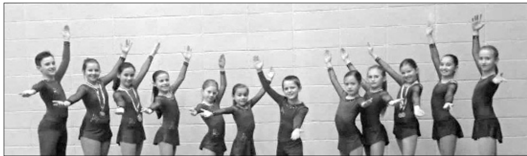
Mlada tekmovalna skupina KŠD Vipava

Vseh 12 tekmovalcev društva s Peči je na pokrajinski fazi prvenstev doseglo lepe rezultate