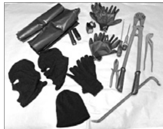
Zaseženo vlomilsko orodje

Trojico so karabinjerji prijeli prejšnji teden v industrijski coni v Romansu, kjer so verjetno nameravali »obiskati« kakšno podjetje. Med patroliranjem so karabinjerji zavili v stransko ulico, kjer so opazili dva parkirana avtomobila s hrvaško registracijo in tri moške, ki so brskali po njih. Pri pregledu dokumentov so ugotovili, da sta dva Hrvatov v preteklosti že bila prijavljena in aretirana zaradi tatvin, v avtomobilih pa so našli vlomilsko orodje, črna oblačila, rokavice in črne vreče, ki jih Hrvati prav gotovo niso nameravali uporabiti za odpadke. Avtomobile je trojica najela na Hrvaškem. Karabinjerji so orodje zasegli, moške pa so ovadili in nato odpeljali čez mejo, kjer so jih izpustili na prostost.