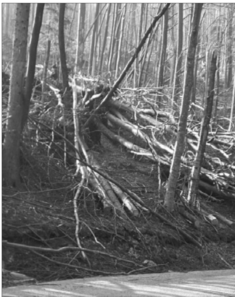
Posledice zledoloma v Trnovskem gozdu

V pozivu na prijavo škode je bila sprva tudi škoda, ki je nastala na kmetijskih zemljiščih in na sadnem drevju. Na kmetijskih zemljiščih škode praktično ni bilo, škoda, ki je nastala na sadnem drevju pa je bila kasneje na predlog kmetijske svetovalne službe izločena iz ocenjevanja škod. Intenzivnih nasadov na omenjenem območju resda ni, so pa t.i. travniški nasadi in kmetije, ki imajo tudi prihodek iz naslova žganjakuhe. (km)