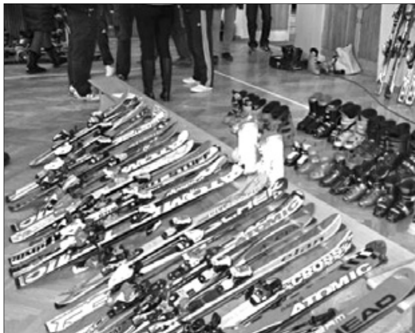
Smučarsko opremo bodo jutri zbirali tudi v Kopru