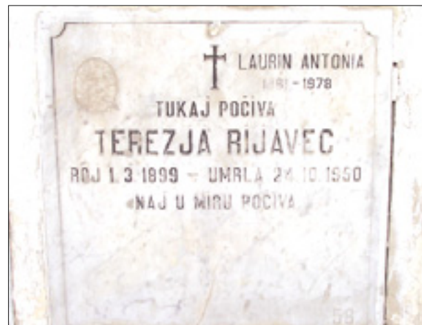
Grob ene izmed aleksandrink v Egiptu

Vsaj še enkrat toliko je umrlih žensk z nejasnim krajem rojstva