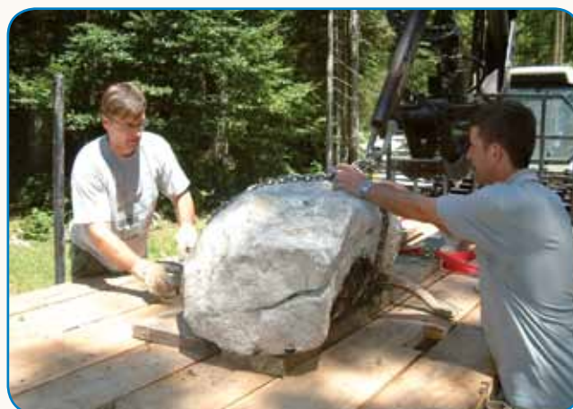
Kamen s Triglava stran 8