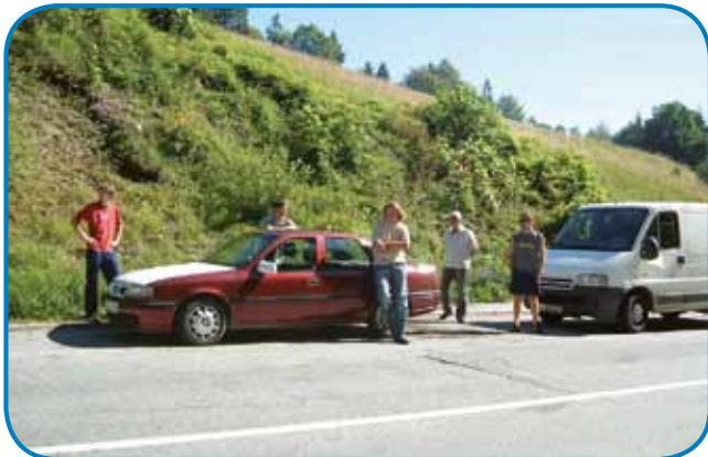
Tak smo se člani andovskega društva pelali po kamen v Triglavski narodni park

Probali smo že vse, depa za vraga smo nej mogli pravi sedmerokotnik vönamalati. Te je prišo nam na pomauč eden »ezermešter«,