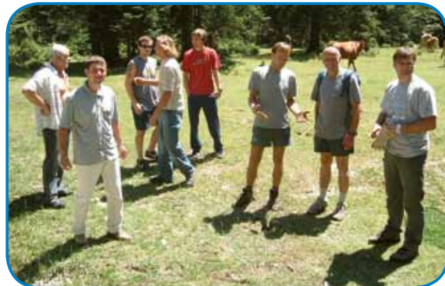
Čakali so nas sodelavci narodnoga parka

birati, spoj pa nej tak velkoga. Mi smo za tau meli dovoljenje od parka, brezi tauga bi gvüšno ka nej mogli tam tak razkapati, ka bi nas nej poštrafali. Dovoljenje smo tū samo zato dobili, ka smo