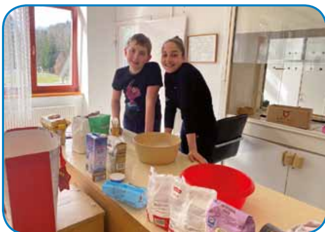
Mate peče pecivo

je tekmoval, katera ladjica bo najhitrejša. Ladjice so plavale po vodi, ker je 8. razred očis-