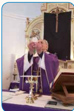
Zahvalna sveta maša stran 6