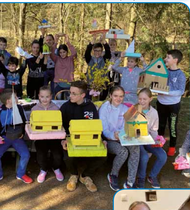
čkom. Prva vrsta je za zmagovalce!

grada. Jaz in moja sošolka sva skupaj delali gregorčka. Moja prijateljica in jaz sva dobili 5. mesto. Prijateljica in sošolka Imola je bila druga. Ona je imela zelo lepega gregorčka, ampak tudi drugi sošolci so imeli zelo lepe gregorčke. Potem smo se skupaj fotografirali. 8. razred je