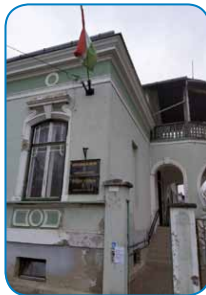
Center za nego starejših v Monoštru, ki je v upravljanju Samoupravnega združenja Monošter in okolica, oskrbuje starejše občane v 14 vaseh in v Monoštru

Evropsko teritorialno združenje Muraba je s 1. marcem pričelo s projektom MOTIVAGE, kate-rega glavni cilj je razvoj čezmejne, starejšim prijazne regije na območju Lendave in Monoštra. Projekt bo poskušal prispevati k številnim dejavnostim za smiselno in aktivno staranje, kot sta organizacija delavnic ali upokojske univerze. Projekt bo trajal do 31. avgusta 2022, njegova vrednost je 338.960 evrov.