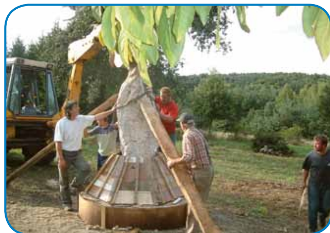
Etak smo ga postavili v Andovci pri Porabski domačiji