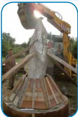
Etak je zgledo po postavitvi in etak pred blagoslovitvijo