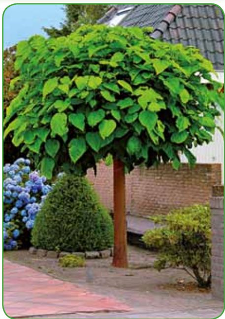
Cigarar (Catalpa). Drevo s kratkim deblom in široko izbočeno krošnjo. Posedanje pod njim je pravi užitek.

vek zasajal mogočna drevesa v okrasne, uporabne namene in s tem zagotavljal ljudem svežino in pod krošnjami prepotreben počitek, nove ideje in zamisli. Drevo predstavlja simbol moči in trdnosti. Spremlja nas od rojstva do smrti. Daje nam poleg sence materialne dobrine in hrano. V javnih nasadih jih opazimo, žal, večkrat vse premalo. Drevnine v