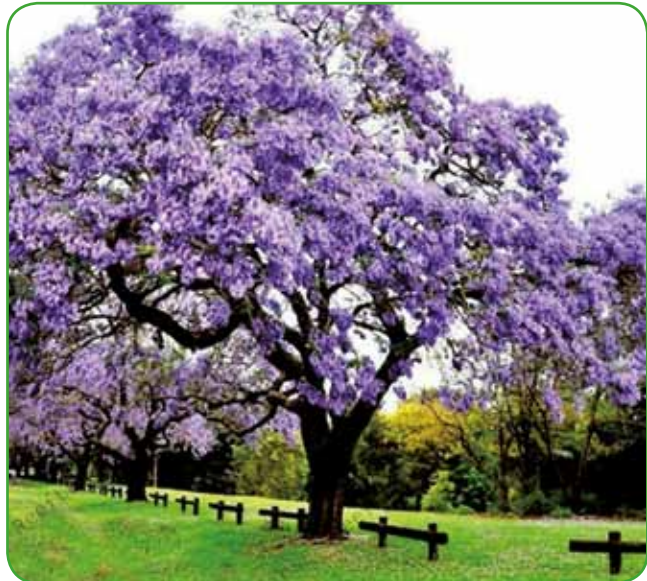
Paulownia spada med najhitreje rastoča drevesa na svetu. Izvira s Kitajske. Tudi pri nas v Prekmurju je razširjeno zaradi velikih listov (80 cm), predvsem pa zaradi lesa, saj zraste v osmih letih 15-20 m visoko. Vrtni krajinarji jo predlagajo zaradi lepih vijoličnih cvetov

Za nas so sadili drevesa naši starši, stari starši, mi pa moramo pomisliti na naše zanamce. Posadimo okrasno ali