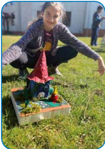
: Pravljičen gregorček učenke Imole, ki je osvojil 2. mesto.