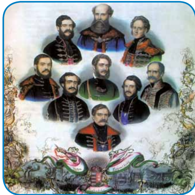
Prva neodvisna madžarska vlada s predsednikom Lajosom Batthyánynom (vrkaj)

Od nejmadžarski narodov so največ želejli Rovatke. Na svojom djilejši na konci marciuša so terdjali vse tisto, ka so Madžari v Beči že dosegnili: zdrü-