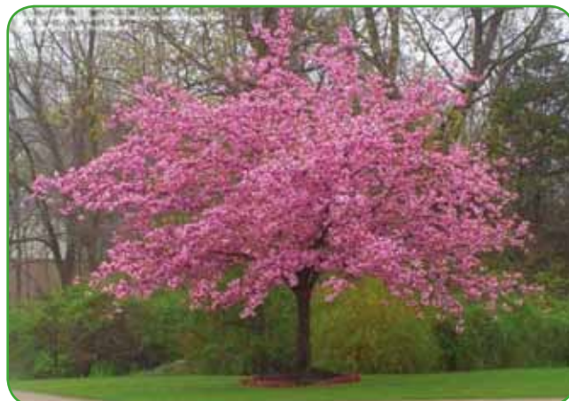
Lijakasta japonska češnja (Prunus serrulata Kanzan) je primerno drevo za majhne vrtove z lijakasto krošnjo. Cvetovi so vrstnati, temno rožnati, rahlo dehtijo. Cveti v mesecu maju.

... da je vanilijeva bazilika najbolj priljubljena z močnim sredozemskim pečatom. Sladokusci jo uporabljajo v raz-