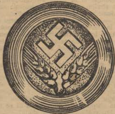
Das ist das Abzeichen unserer Arbeitsmädchen

»Arbeitsmädchen« so s svojim zvonikom smehom po travnikih in njivah, po vrtovih in kmečkih kuhinjah dvigale tudi naše veselje do kmečkega dela. V delovni službi med njimi ni razlike. Uradniška hčerka je kidala gnoj z isto vnemo, s katero je visokošolka pospravljala kmečko kuhinjo ali pa opravljala delo na vrtu. V svoji vzorni povezanosti in strumni disciplini so v taboriščih in na kmetijah dokazale, da so vredne slovesa, ki so si ga že poprej s polnim pravom zaslužile po vsej Nemčiji.