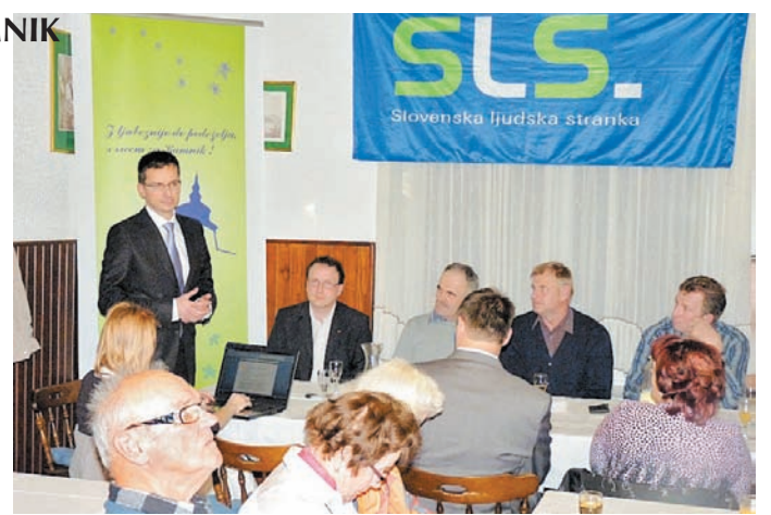
Župan občine Kamnik Marjan Šarec je pozdravil zbrane na občnem zboru SLS Kamnik.

V letošnjem letu si bodo v kamniški SLS prizadevali, da dobijo na svojo stran mlade člane