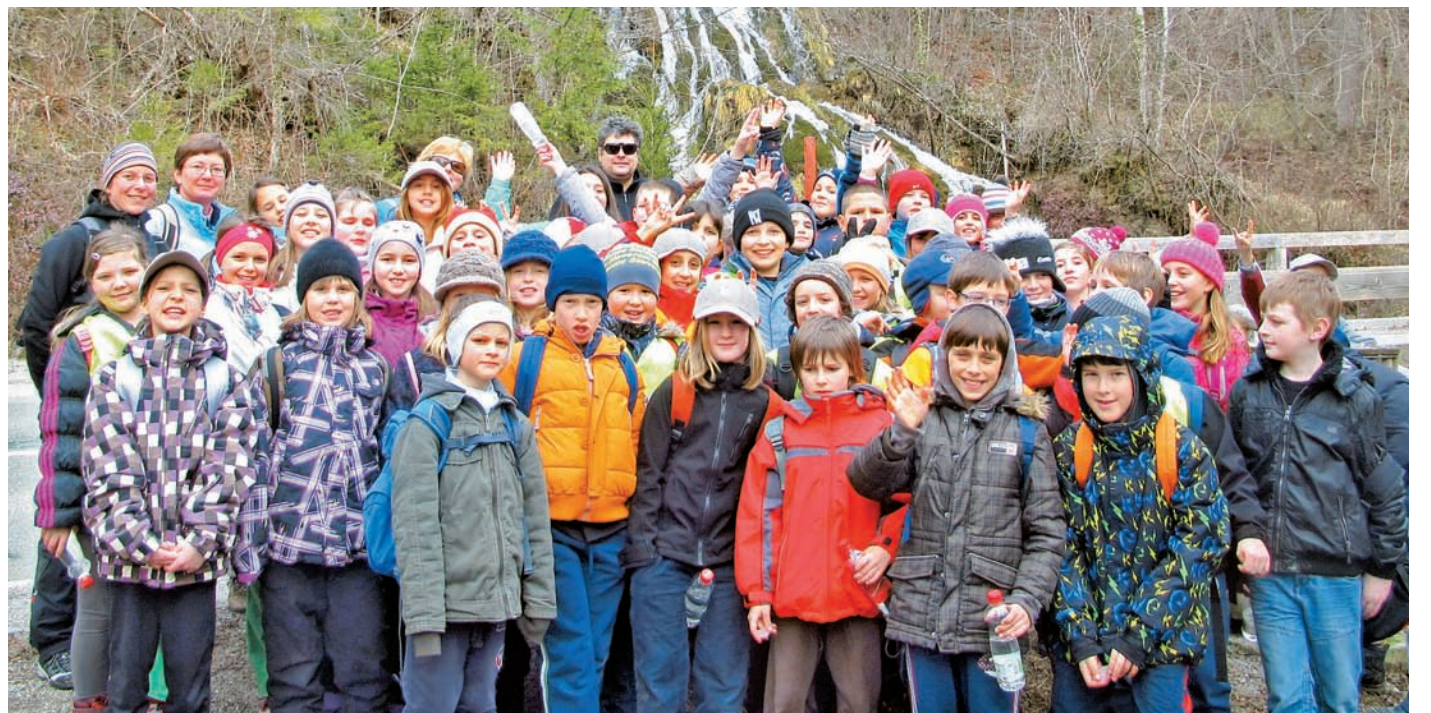
Učenci pred slapom Nežica.

Novoizvoljenemu predsedniku Športne zveze Kamnik je čestital tudi župan Marjan Šarec in mu zaželel veliko uspeha pri delu ter izrazil željo, da bosta šport in Občina še naprej delovala z roko v roki.