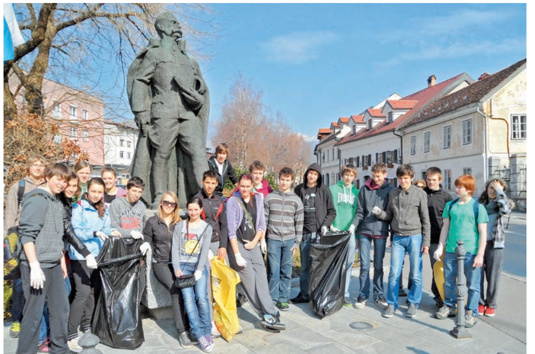
Že dan pred začetkom vseslovenske akcije – v petek, 23. marca, so dijaki ŠCRM čistili okolico šole in mesto. Še posebej skrbno so očistili zelenico okrog spomenika generala Rudolfa Maistra, po katerem njihova šola nosi tudi ime.

Skupni napori vseh udeležencev akcije so rezultirali v