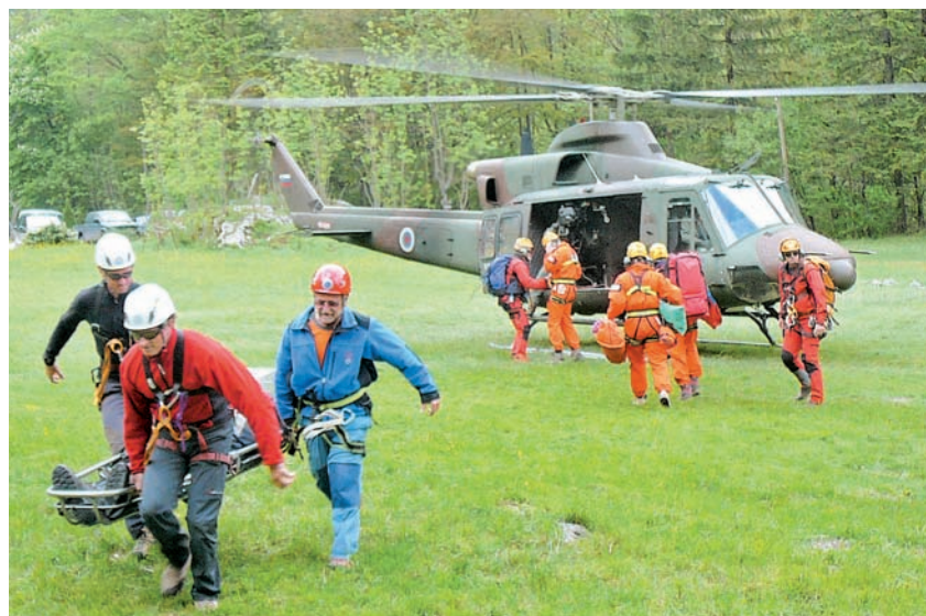
Helikopter je pomemben člen v reševanju, saj pomeni bistveno hitrejši prevoz ponesrečenega v zdravniško oskrbo.

Izpostavim lahko intervencijo, ko smo reševali planinko, ki jo je v dolini Kamniške Bele na poti proti Presedljaju pičila osa. Doživela je anafilaktični šok in bi brez naše pomoči verjetno umrla. Posebnost je bila v tem, da se je v reševanje, ker helikopter gorske reševalne službe ni bil dosegljiv (poletel je na intervencijo v Bovec), vključil helikopter nujne medicinske pomoči. Posadki je na podlagi posredovanih ji informacij uspelo locirati mesto nesreče, izstopiti iz helikopterja v lebdječem