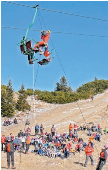
Prikaz delovanja ABS nahrbtnika za preživetje v plazju ter reševanja s sedežnice.