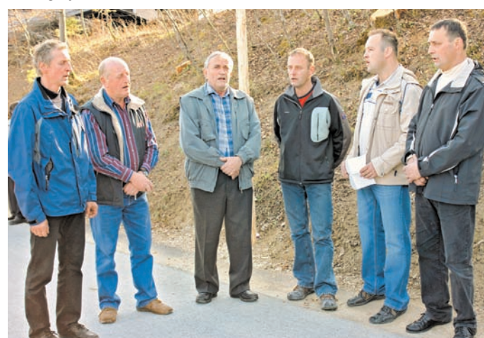
V kulturnem programu so zapeli pevci Tunjiškega okteta.