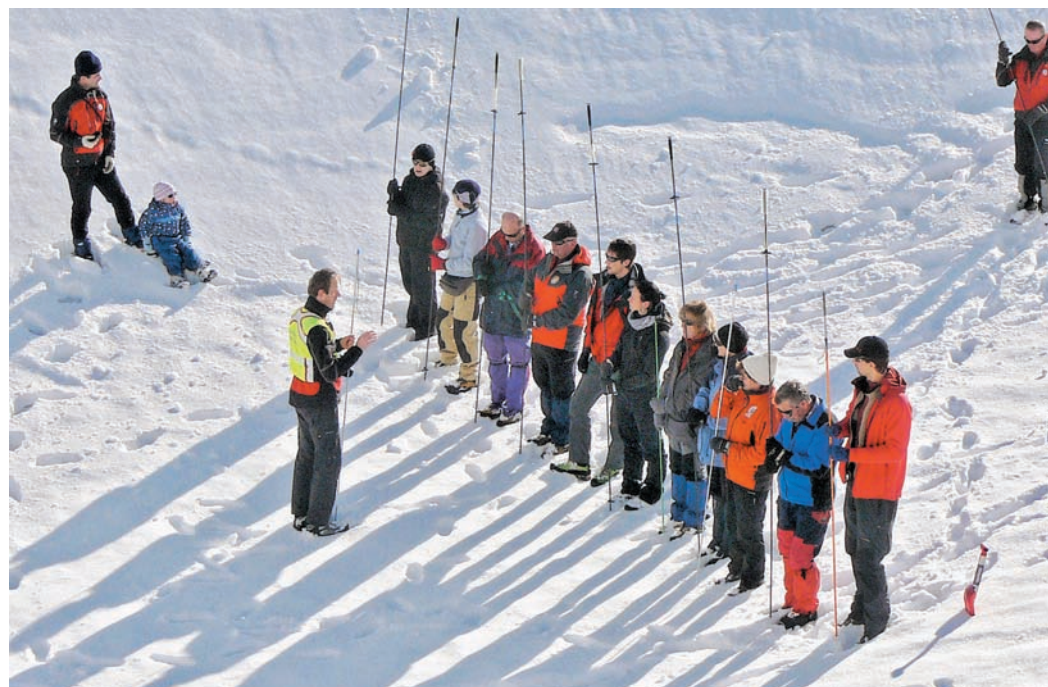
Skupinska slika večine članov DGRS Kamnik maja 2011.