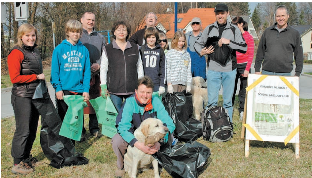
Tudi krajanje naselja B-8 Zg. Perovo so se delovno in z dobro voljo lotili čiščenja odpadkov v svoji krajevni skupnosti Novi trg.