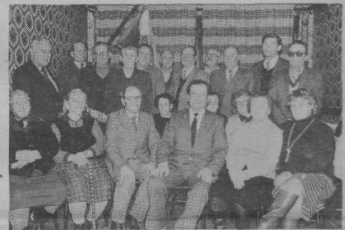
Člani združenja oziroma sekcije VVI Večve — Zgornji Kašelj, ki so bili navzoči na seji. Zaradi zdravstvenih razlogov se osem članov skupščine ni moglo udeležiti.