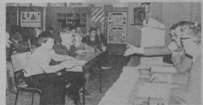
Ekipa je imela na voljo za razmislek le pet minut, naker je morala odgovoriti na tri vprašanja