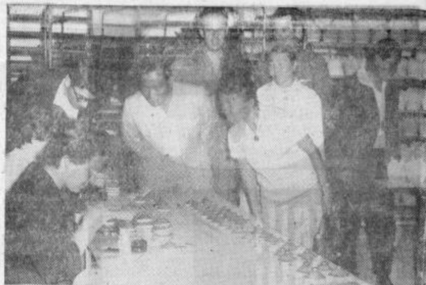
Pretekli teden je Celje obiskala skupina visokih gostov — članov glavnega odbora sindikatov iz Mongolije ter s med svojimi dvodnevni bivanjem v Celju ogledala tovarno emajlirane posode. Med ogledom tovarne so se gostje pogovarjali s predstavniki sindikalne organizacije o vlogi in delu sindikalne organizacije v tovarni, s predstavniki občinskega sveta pa o vlogi sindikalne organizacije v komunih. Naslednji dan so sindikalni funkcionarji iz Mongolije, ki so se kot gostje Glavnega odbora zveze sindikatov Jugoslavije več dni zadržali v Sloveniji — ogledali še žalski Kmetijski kombinat in obiskali rudarski kolektiv rudnika lignita v Velenju. Posnetek prikazuje goste, med ogledom proizvodnega procesa v celjski tovarni emajlirane posode.