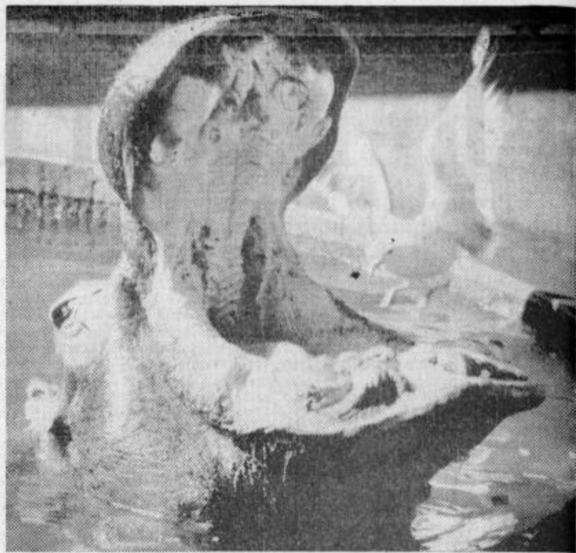
Leteče zobne ščetke bi lahko imenovali galebe, ki so po svoji iznajdljivosti, kadar gre za pridobivanje hrane, prav presenetljivi. Galeb na naši sliki je redni obiskovalec nekega ameriškega zoološkega vrsta, kjer neguje zobovje mladih konj. Debeluhom ta nega očito ugaja.

Sovjetski konstruktorji na nekem inštitutu v Moskvi so skonstruirali prvo atomsko elektrarno na kolesih. Težka je 350 ton in je nameščena na štirih gigantskih kamionih z gosenicami, pripravljeni za vsak teren. Elektrarna je sposobna, da oskrbuje z električno energijo mestce z deset tisoč prebivalci. Atomsko elektrarna porabi dnevno 14 gramov nuklearnega goriva. Kot kaže, bodo v kratkem pričeli s serijsko proizvodnjo teh »namuznih atomskih elektrarn«, kajti namenjene so za številna odročna področja v Sibiriji.