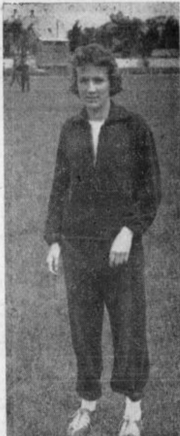
Lubejeva je nastopila bolna