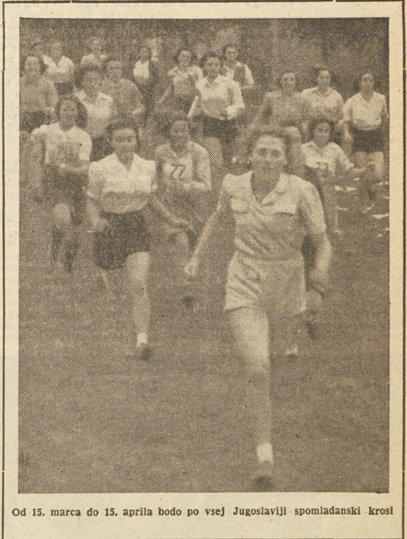
Od 15. marca do 15. aprila bodo po vsej Jugoslaviji spomladanski kroši

Posebni vlak: Poleg posebnih vlakov, na glavni dan prireditve »Plani-