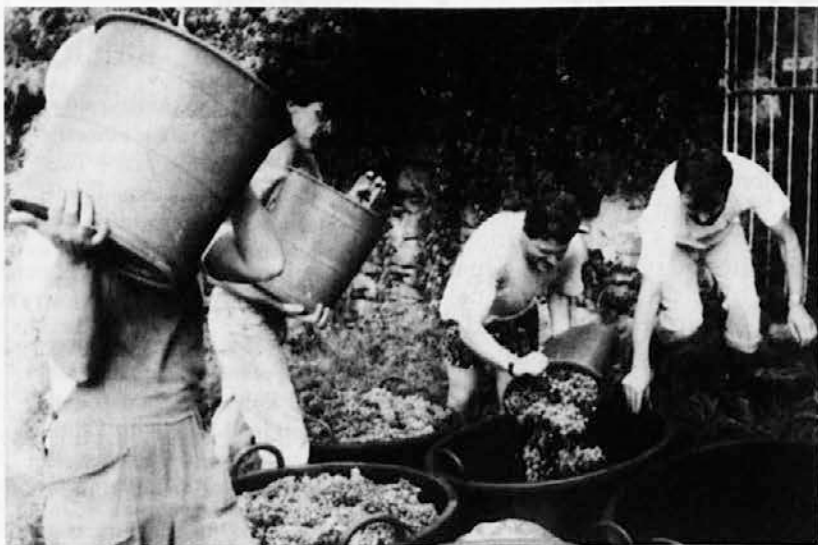
Posnetek z letošnje trgatve v Križu