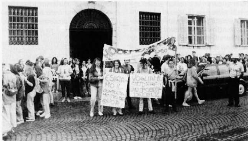
Zborovanje slovenskih dijakov pred občinsko palačo v Gorici