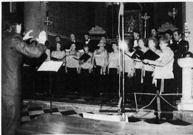
Prizor s koncerta Vodopivčevih skladb v Podgori