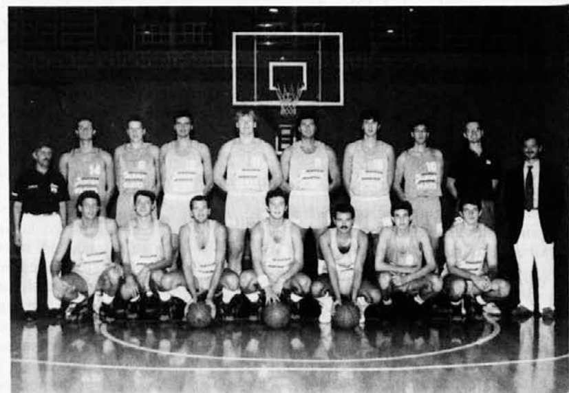
Ekipa Jadrana v sezoni 1992/93