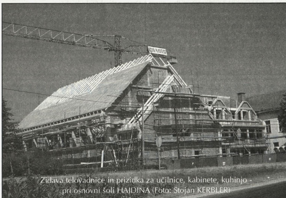
Zidava telovadnice in prizidka za učilnice, kabinete, kuhinjo - pri osnovni šoli HAJDINA

Ob 1. prazniku mestne občine Ptuj izrekava vsem prebivalcem mestne občine Ptuj iskrene čestitke ter želiva prijetno in sproščeno praznovanje.