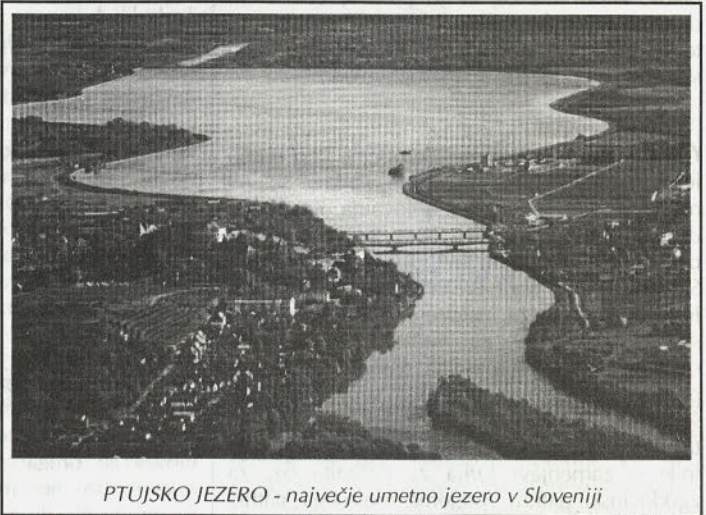
PTUJSKO JEZERO - največje umetno jezero v Sloveniji

Premeščanje sedimenta pomeni, da bi odstranili sediment iz plitvin, kjer je oviran razvoj vodnih športov. Z njim bi zgradili umetne otočke ali pomole tam, kjer to ustreza namenu.