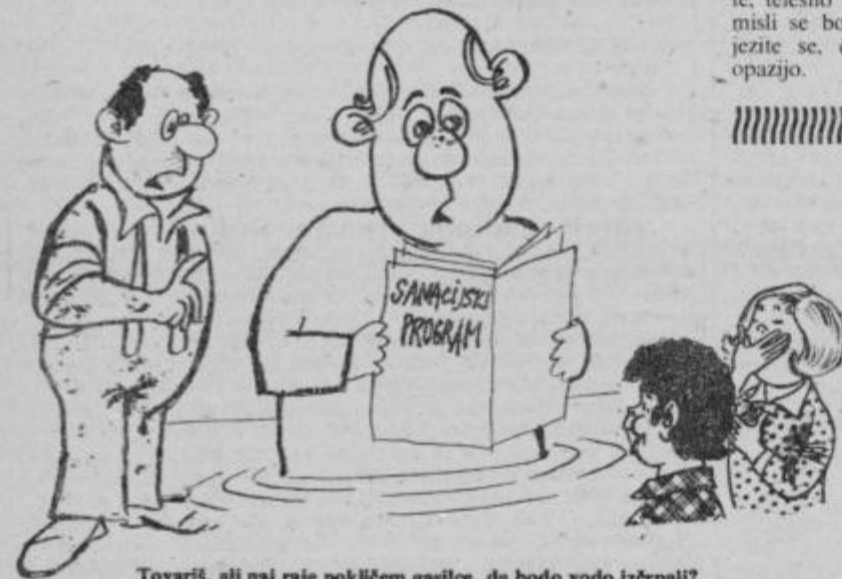
Tovariš, ali naj raje pokličem gasilce, da bodo vodo izčrpali?