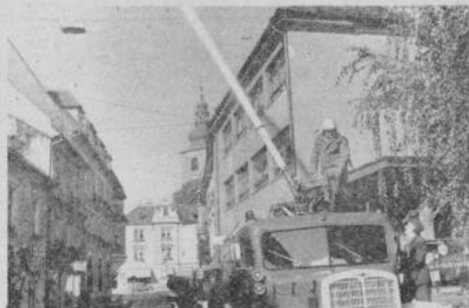
Ptujski gasilci top v akciji pri „požaru“ v starem mestnem jedru.

Oktober je tudi mesec požarne varnosti, letos poteka pod geslom VSI ZA POŽARNO VARNOST! Tudi skozi ves oktober se bodo zvrstile številne gasilske vaje in druge požarno-preventivne akcije, ki smo jim dali še poseben poudarek v okviru letošnje akcije NNNP 82. O drugih akcijah več v prihodnji številki Tehnika. Tokrat nekaj besed o nedeljski praktični mokri vaji ptujskih gasilcev.