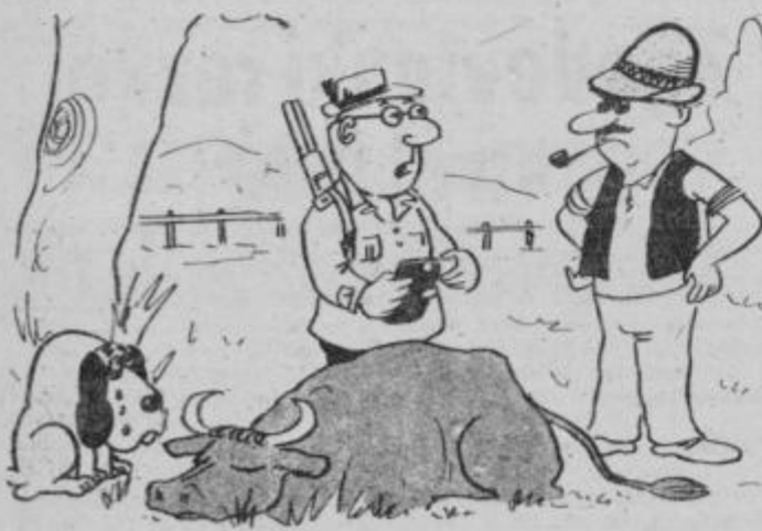
Seveda vam jo bom plačal po teži, le težo svinca, ki je v njej bova odbila...