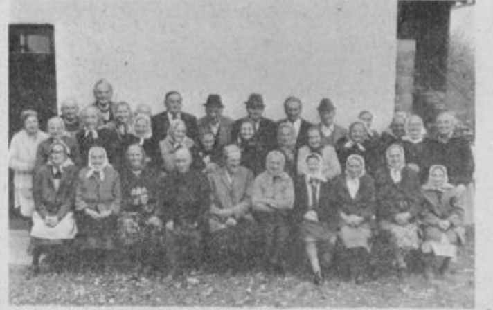
Spominski posnetek s srečanja starejših na Polenškaku