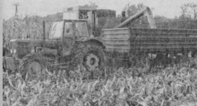
Mudi se predvsem s spravilom koruze. Te površine je potrebno preorati in posejati s pšenico.