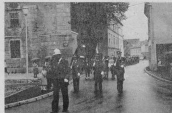
Parada po ulicah občinskega središča je prikazala opremljenost in tehniko gasilstva bistriške občine v tem času.

Aktivnosti v društvu posvečajo veliko pozornosti tako zagotovitvi sodobne opremljenosti, orodja in vozil kot tudi pomlajevanju vrst. Prav na tem področju so zelo uspešni, saj imajo