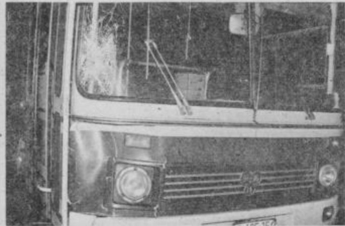
Avtobus Komunalnega podjetja Ptuj je trčil v kolesarja s prednjim desnim delom.

Minuli teden, od 12. do vključno 19. oktobra je na cestah ožjega območja ptujске občine spet zahteval smrtno žrtve — tokrat kolesarja. Razen tega so miličniki postaje milice Ptuj in oddelkov posredovali še v dveh lažjih