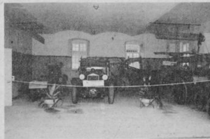
Iz stoletnega razvoja društva. Uspela razstava v gasilskem domu je vzbudila veliko zanimanje občanov in gasilcev bistriške občine.

V zadnjem času društvo posveča posebno pozornost usposabljanju članstva na področju SLO in DS. Med pomembnimi aktivnostmi so tudi vsakoletna organizacija tečajev za lastnike motornih čolnov, katerih se udeležujejo tudi