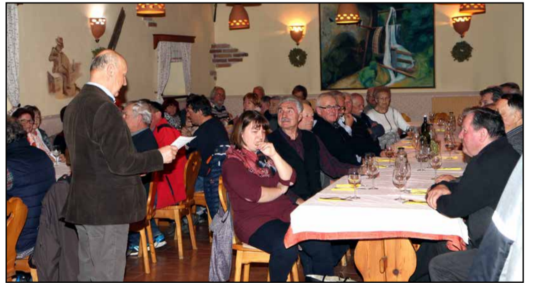
Z rednega zbora vinogradnikov

Pri obrambnem stolpu pri žalski župnijski cerkvi sv. Nikolaja so savinjski vinogradniki v sredo, 20. marca, pripravili krajšo slovesnost ob rezi potomke najstarejše vinske trte na Slovenskem, ki so jo v Žalcu posadili ob vstopu Slovenije v Evropsko unijo (letos od takrat mineva 15 let). Nato so imeli v Gotovljah letni zbor.