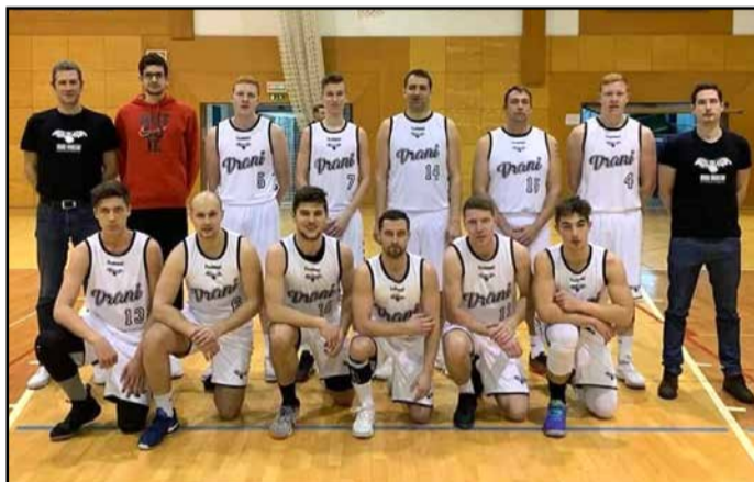
Članska ekipa Vrani Vransko

Bodo pa v zadnjem delu pokalnega tekmovanja K40, kjer se bodo v četrtfinalu pomerili proti moštvi Ihana, nastopili v povsem novih uniformah. Te so domačemu občinstvu premierno predstavili na zadnji tekmi v domači dvorani.