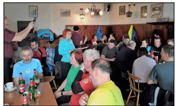
Po pohodu druženje s kulturnim programom v Planinskem domu na Mrzlici