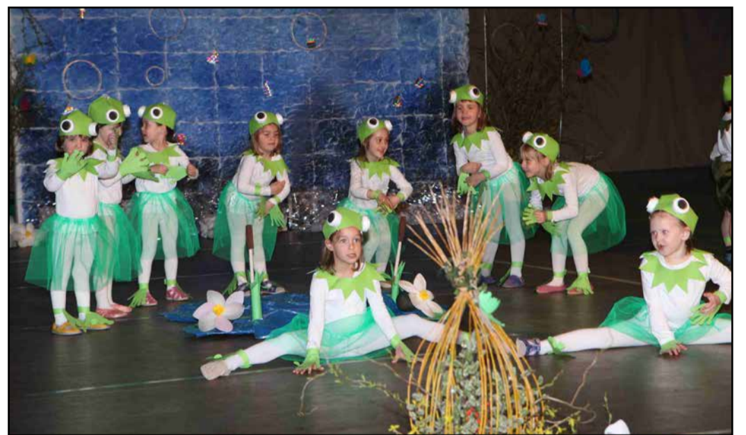
Zabice vrtca navdušile starše.

Minuli četrtek so zaposleni z otroki Vrtca Polzela pripravili že tradicionalno prireditev Praznik družin in pomladi, ki je bila naravoslovno obarvana, saj je bila povezana s temo »voda«.