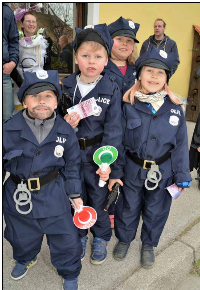
Pust je poskrbel tudi za podmladek naše policije.