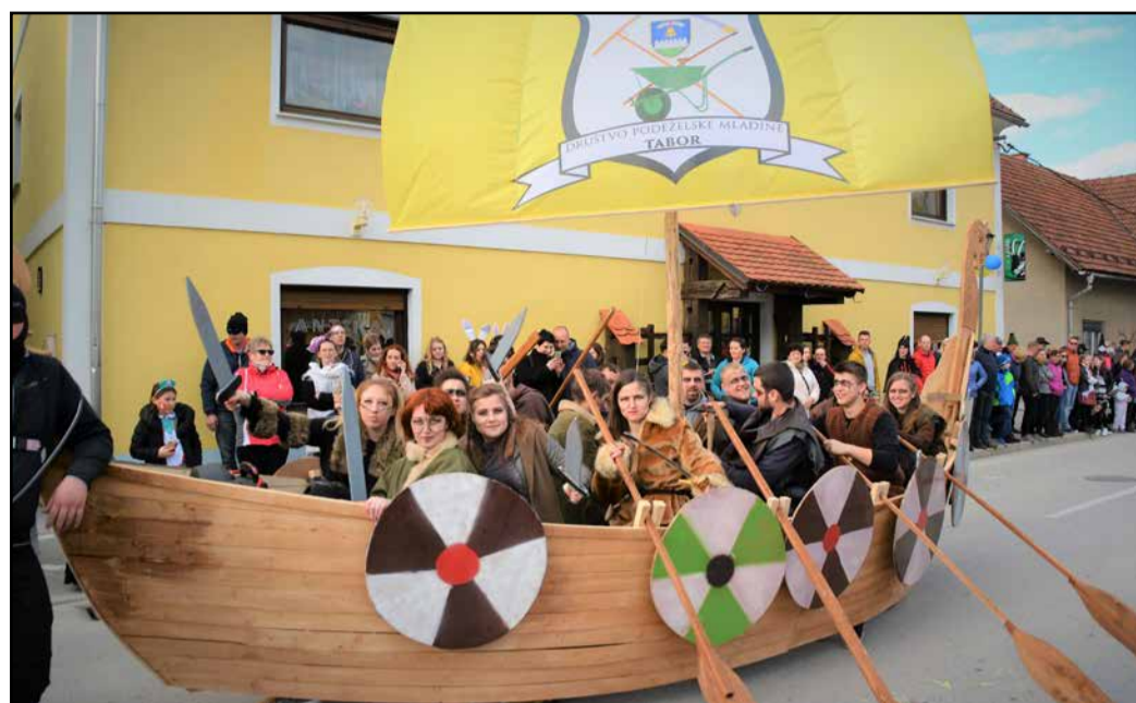
Vikinci so priveslali na Vranksko s taborskega morja.