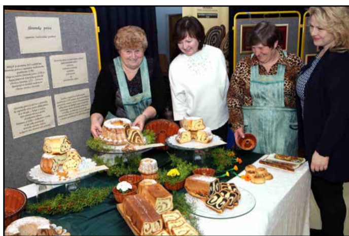
Društvo podeželskih žena je pripravilo razstavo potic.

S promocijo naše slovenske kakovostne hrane pod naslovom Naša super hrana je Ministrstvo za kmetijstvo, gozdarstvo in prehrano (MKGP) predstavilo shemo kakovosti Izbrana kakovost. Mlekarna