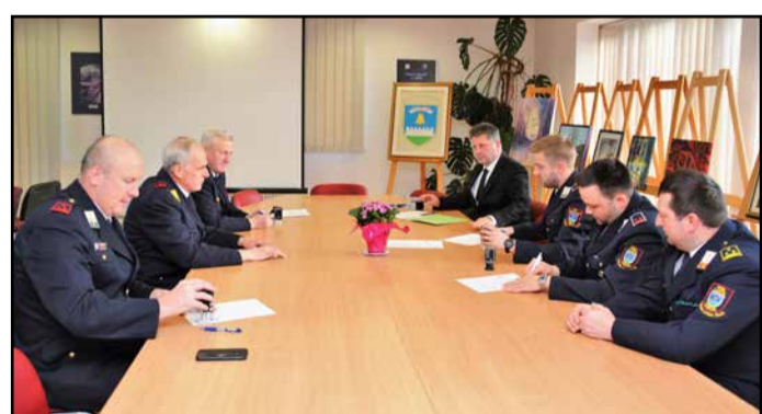
Gasilci med podpisom pogodbe z županom