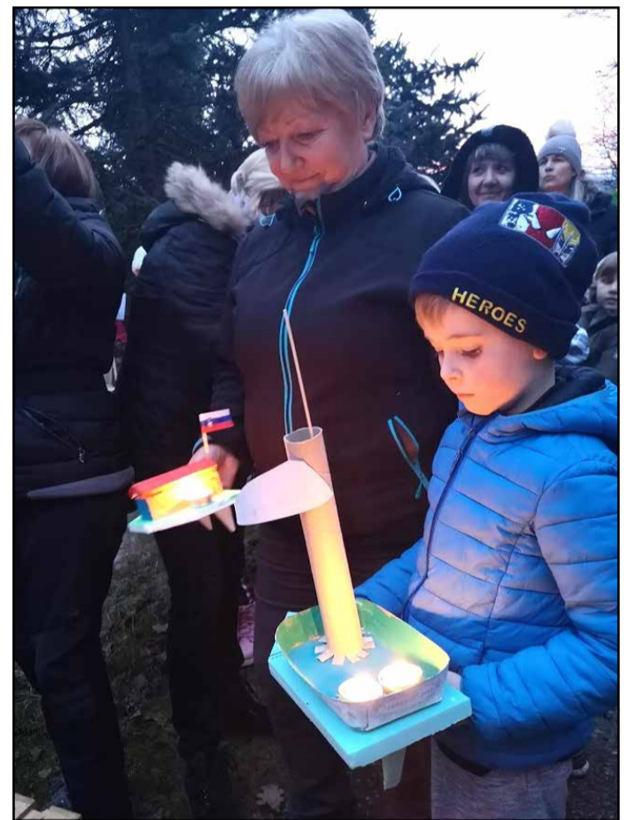
Gregorčki iz stiroporja in papirja