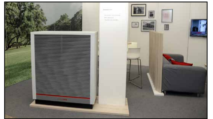
Z letošnjega sejma Dom na Gospodarskem razstavišču v Ljubljani

Kot primarni vir toplote črpalka izkorišča toploto zemlje, ob morebitnih ugodnejših temperaturah zraka pa preklopi način delovanja in kot vir toplote izkorišča zunanji zrak.