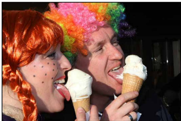
Tokrat namesto krofov sladoleđ