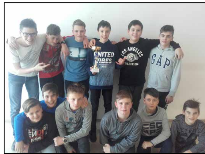
Področni šolski prvaki v košarki z OŠ Prebold

Šolska tekmovanja v košarki potekajo v sklopu Košarkarske