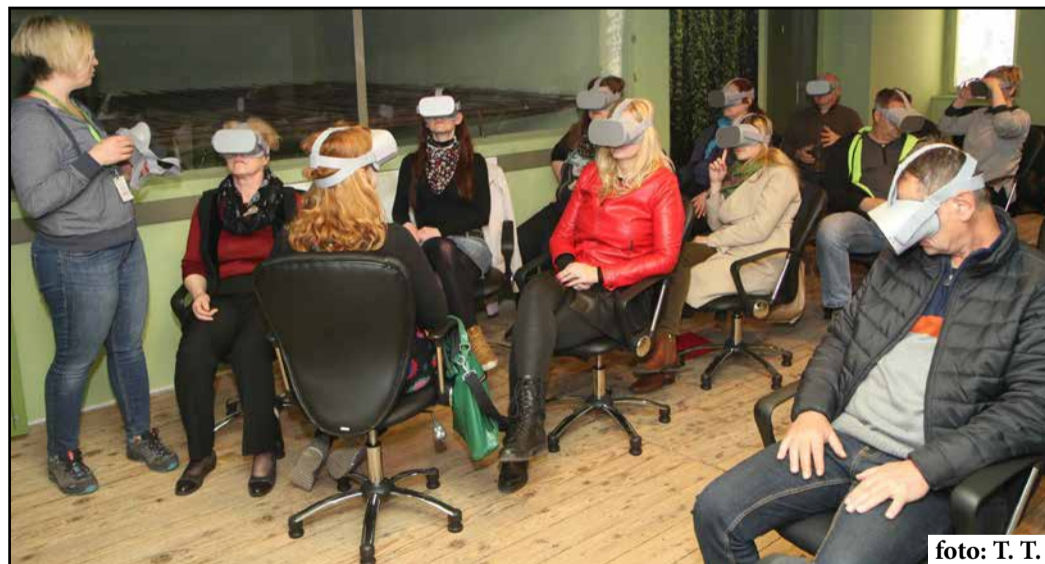
Obiskovalci bodo s pomočjo virtualnih očal in ogleda filma v 360-stopinjski 3D-tehnik tako rekoč del zgodbe, ki jo bo film pripovedoval.