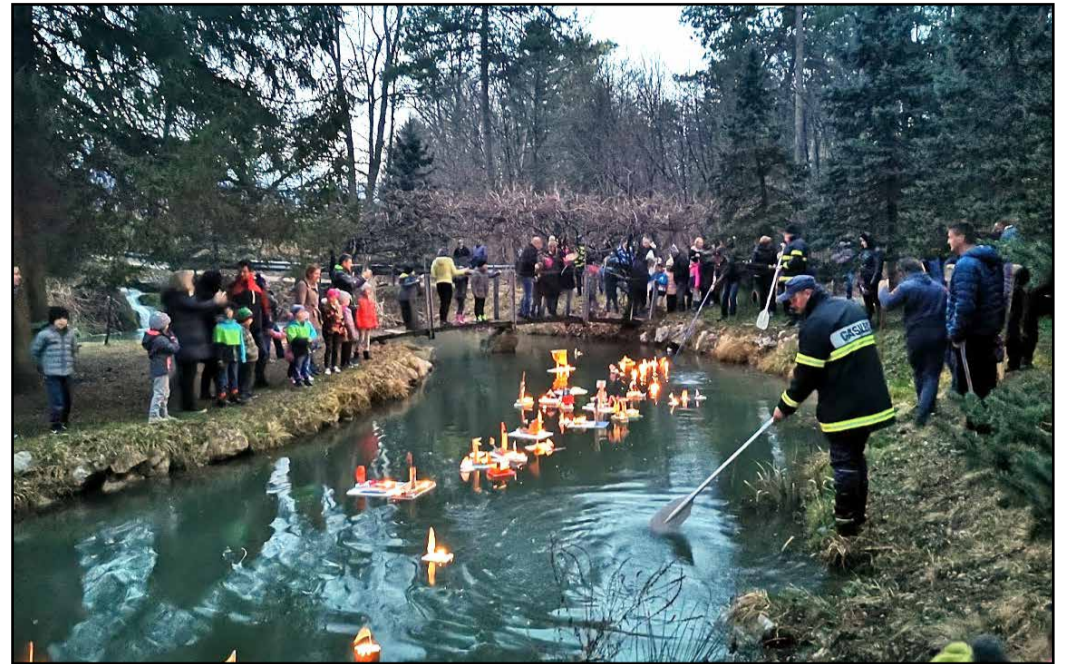
Gregorčki zaplavali in osvetlili reko

Gregorjevo je star običaj, ki se je v večji ali manjši meri ohranil po različnih koncih Slovenije. Za letošnje prvo praznovanje gregorjevega v Občini Braslovče je podalo pobudo Turistično društvo Braslovče, ki s svojimi prireditvami že slovi po prenašanju navad in običajev ter poznavanju nekdanjega življenja in dela ljudi braslovškega podeželja na mladi rod.