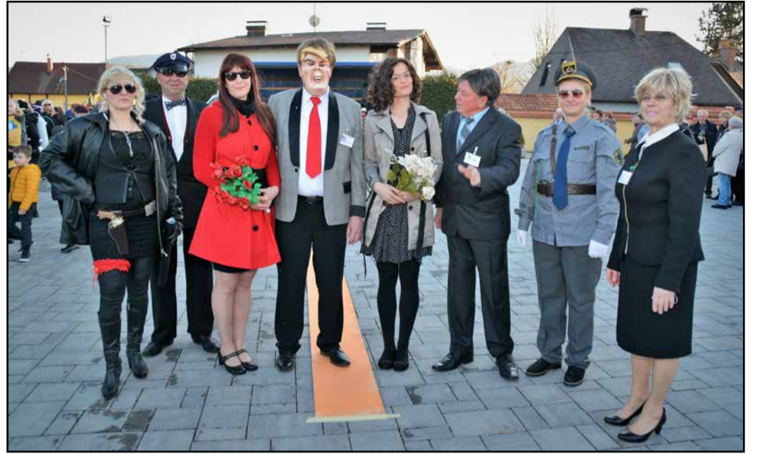
Donald Trump in Melania sta obiskala žalskega župana in gospo županjo, da bi podprla projekt Hopslandije.

V naši dolini je bil največji pustni dogodek tudi letos Vrnski pustni karneval, ki je letos praznoval že 60-letnico. Poleg njega se je v tem pustnem času zvrstilo še več manjših karnevalov oziroma maškard po vseh drugih spodnesavinjskih občinah.