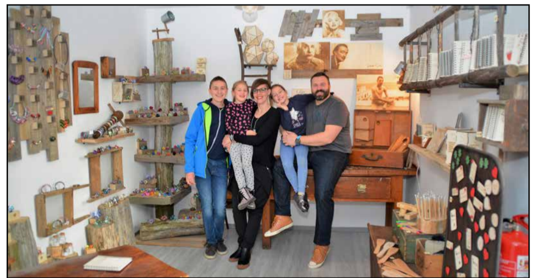
Družina na dan odprtja v ateljeju