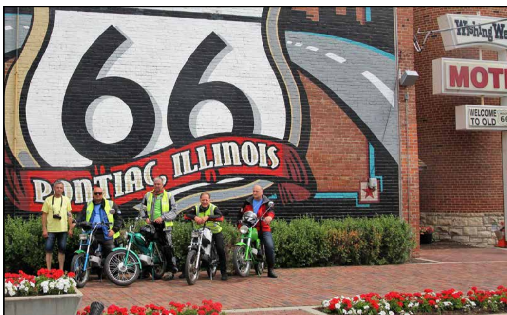
Prevozili so tudi slavno cesto Route 66, ki vodi skozi šest zveznih držav.

Mopedi so zdržali brez večjih okvar, prevozili so 6300 km, porabili skupaj 600 litrov goriva, na zadnjih plateg pa so popotniki imeli za spoznanje