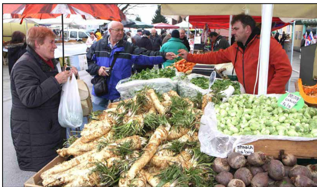
Ni ga čez lokalno pridelano hrano.

Slovenska potica je pečena v potičniku, ki zagotavlja edino pravo obliko potice, in sicer je ta okrogla, z luknjo v sredini,