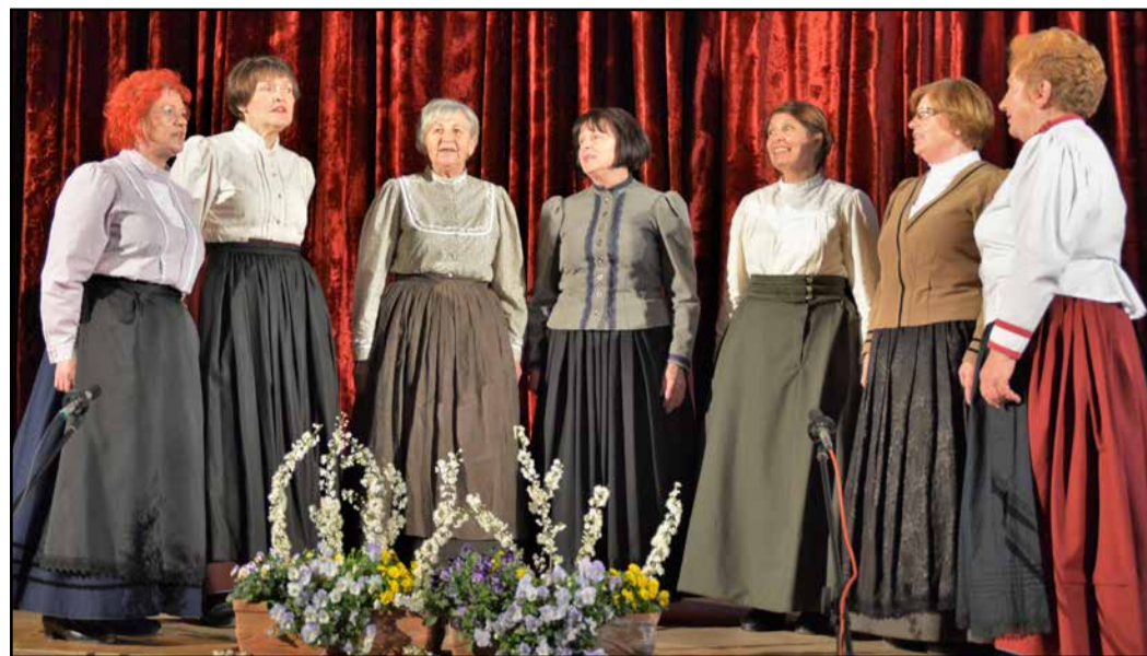
Nastop organizatork, pevk FS Grifon Šempeter