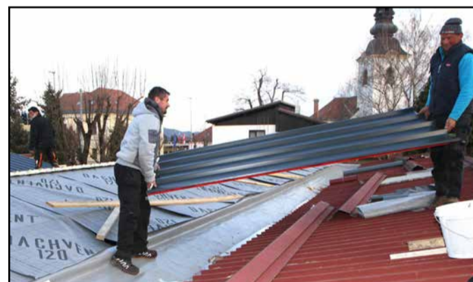
Sanacija strehe na vrtcu