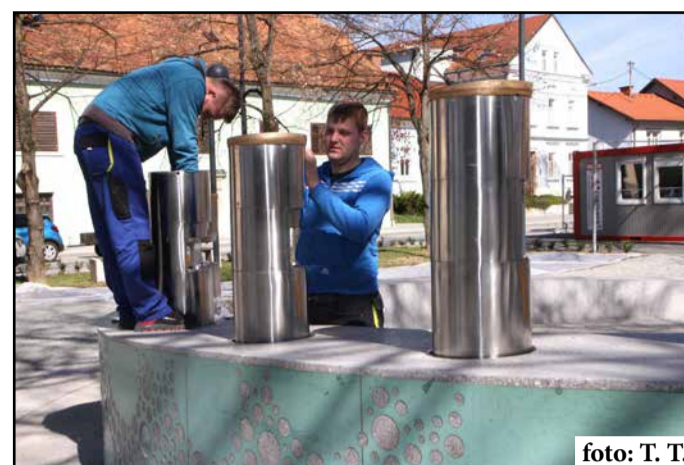
Priprave na novo sezono fontane

Kot je povedala, bo maja zaživela tudi kulinarčna tura Pivo in pajs, ki bo združevala hmeljarsko in pivovarsko zgodbo Žalca in okolice. Kulinarčno vodi kulinarčni vodnik in je namenjena omejenemu številu udeležencev (največ osem ljudi). Vključuje obisk gostinskih ponudnikov, ki ponujajo