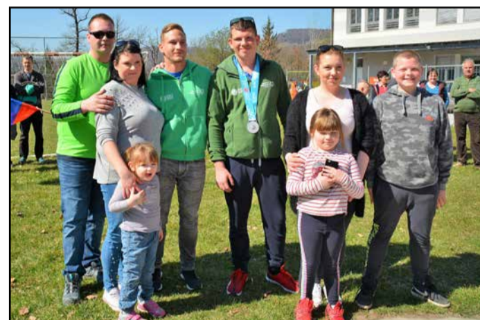
Žigova družina (s trenerjem, tretji od leve), v kateri mu družbo delajo še brat in tri sestre.

znajo poskrbeti za dobro voljo, pomoč sokrajanom ter še za marsikaj.