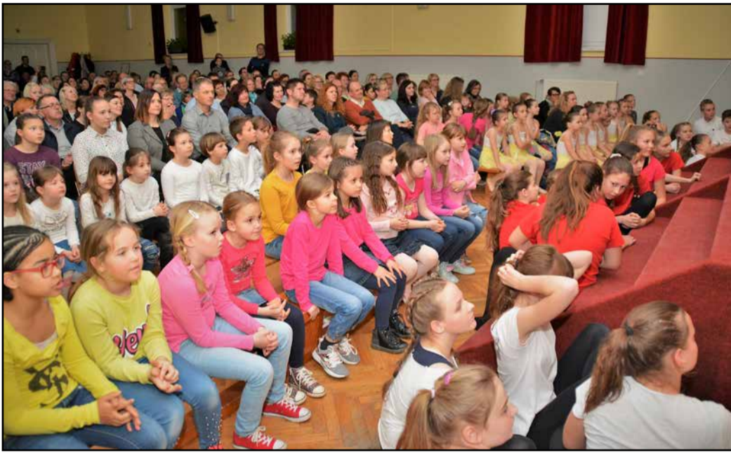
Množično praznovali ženskam posvečene praznike v Petrovčah.

V mnogih krajih po naši dolini ohranjajo tradicijo praznovanja mednarodnega dneva žena. Ponekod ga združijo tudi z materinskim dnevom, 25. marcem.