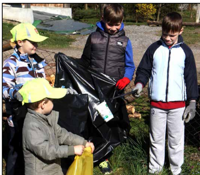
Tudi najmlajši iz Topovelj so se udeležili akcije.