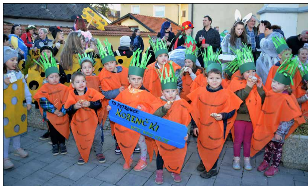
Da je uživanje domače zelenjave zdravo, so povedali "korenčki" v Petrovčah.

ko leto izberejo posebno temo oziroma lik ali like iz pravljic ali druge priljubljene junake, ki navdušujejo otoke. Letos je bila to lepa deklica Heidi iz švicarskih gora, ki je živela pri svojem dedku. Pustne skupine pa so z različnimi maskami tvorili otroci iz vrta v POŠ Trje, ki so se predstavljali tudi s plesnimi in pevske nastopi.