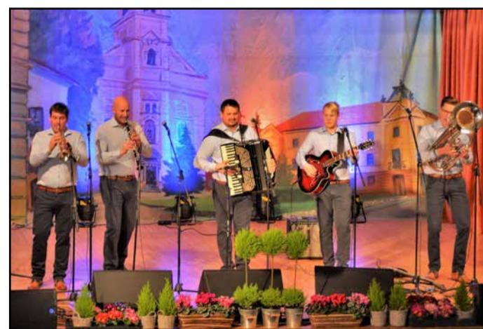
Med nastopom ansambla Juhu