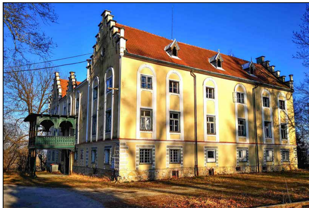
Dvorec Štrovsenek v Šmatevžu

Graščina Štrovsenek v Šmatevžu skupaj s tamkajšnjim parkom predstavlja za Občino Braslovče izjemno kulturno in zgodovinsko dediščino. Po letih propadanja