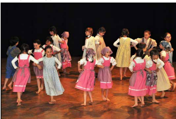
S plesom in glasbo dajo vsako leto svoj pečat 8. marcu učenci OŠ Griže.