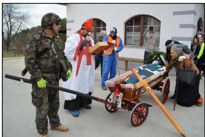
Letos so se od pusta poslovili samo v Libojah.