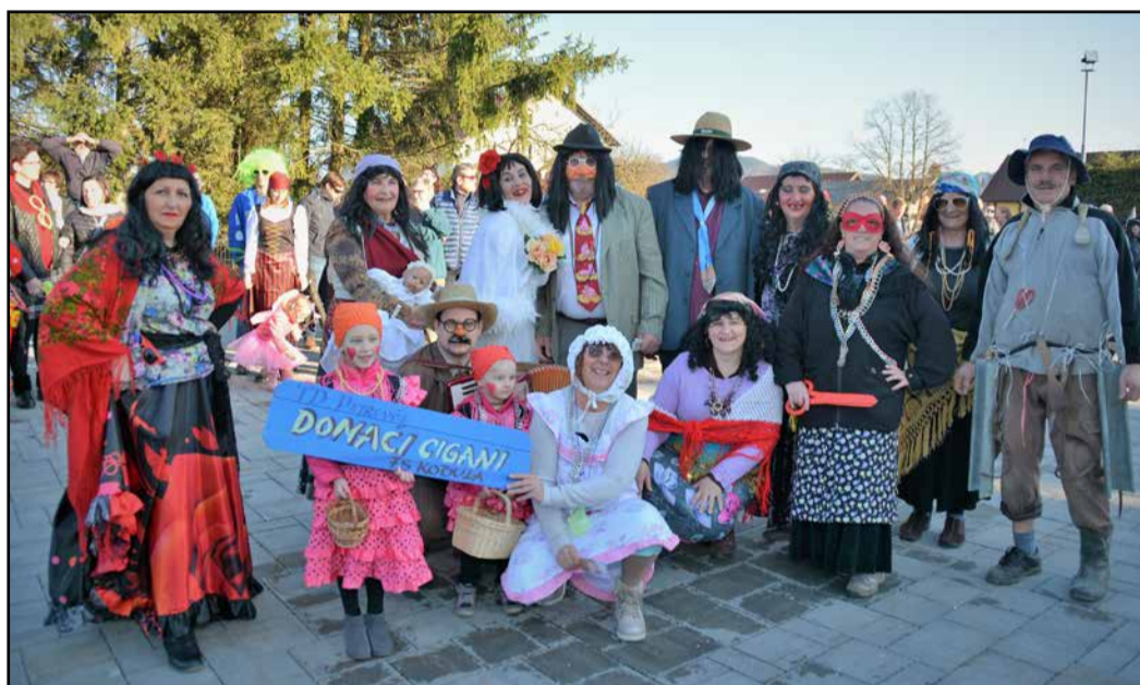
Ni je slovenske vasi brez pristne ciganske družine.