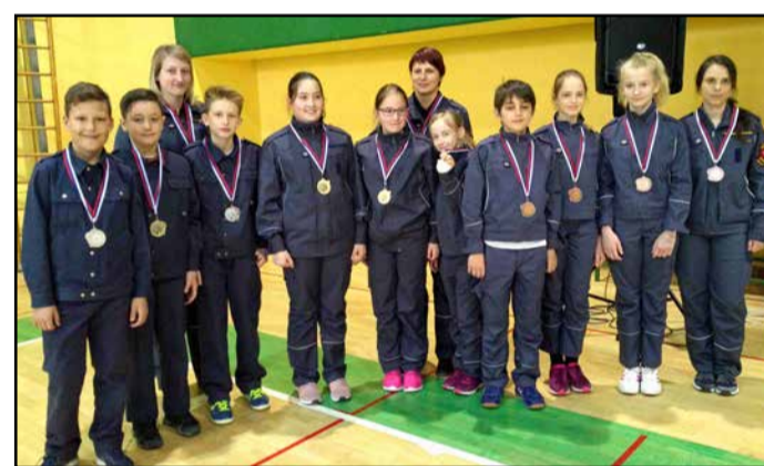
Najboljše tri ekipe pri pionirjih z mentorici. Na sredini ekipa PGD Okonina (1. mesto), na desni Trnava (2. mesto), na levi Kapla - Pondor (3. mesto).

Najboljše tri ekipe med pionirji: 1. PGD Okonina, GZ Zgornje Savinjske doline, 2. PGD Kapla - Pondor, GZ Žalec, 3. PGD Trnava, GZ Žalec; mladinci: 1. PGD Lokovica, GZ Šaleške doline, 2. PGD Ojstriška vas - Tabor, GZ Žalec, 3. PGD Lokovica 2, GZ Šaleške