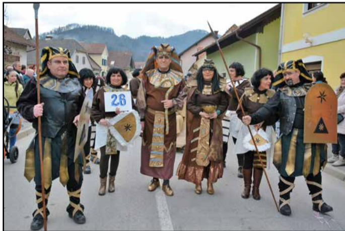
Faraoni v slikovitih oblačilih so si prislužili na Vrnskem drugo nagrado.