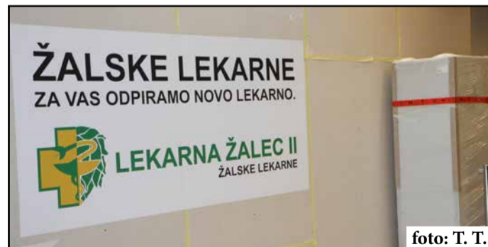
Nova enota lekarne bo dobrodošla pridobitev.