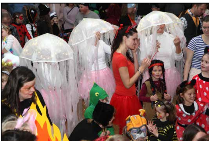
Meduze plavale na raslovski maškardi