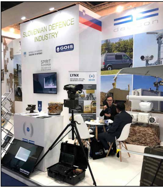
Z razstavnega paviljona v Abu Dhabiju

V Abu Dhabiju, prestolnici Združenih arabskih emirats, je do 21. februarja potekal sejem vojaške industrije IDEX. Na njem se je pod okriljem javne agencije Spirit na skupnem razstavnem prostoru predstavilo sedem slovenskih podjetij, med njimi tudi podjetje Dat - Con s Polzele, ki izdeluje merilno-regulacijsko opremo ter posebno elektroniko za potrebe vojske in policije.