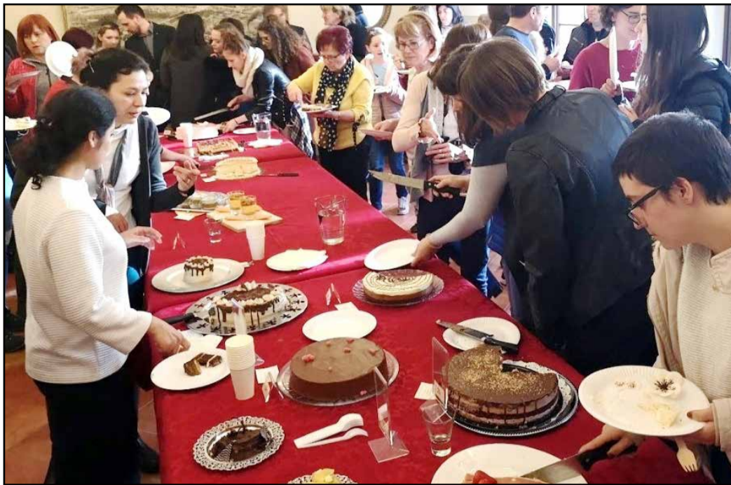
Po razglasitvi najboljših tort je za obiskovalce sledil še najboljši del – posladkali so se lahko z vsemi prispelimi tortami.

Tretjo soboto v marcu so se v dvorcu Novi kloster v Založah pri Polzeli vnovič zbrali ljubitelji peke tort, slaščičarji in dijaki poklicnih slaščičarskih programov. Društvo Dvorec je že drugo leto zapored organiziralo tekmovanje Kdo ima najboljšo torto.