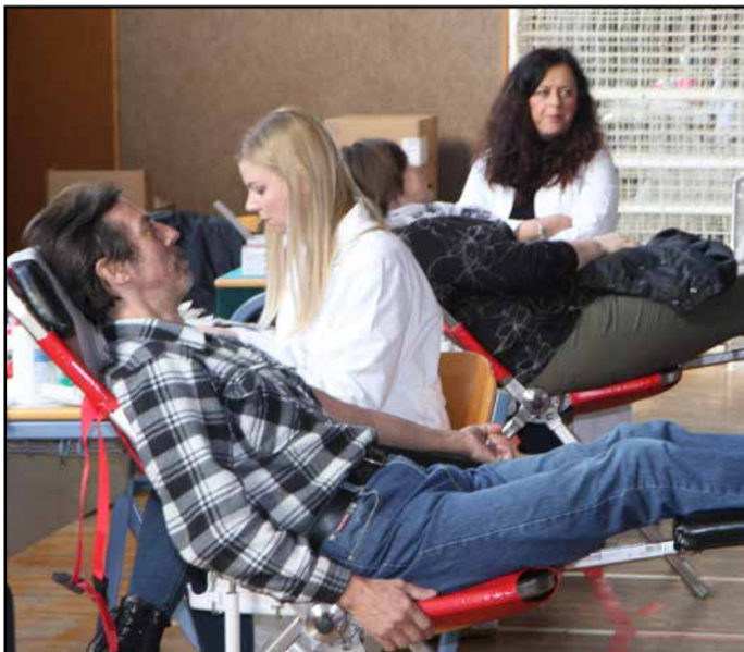
S tretje akcije v telovadnici UPI Ljudske univerze Žalec