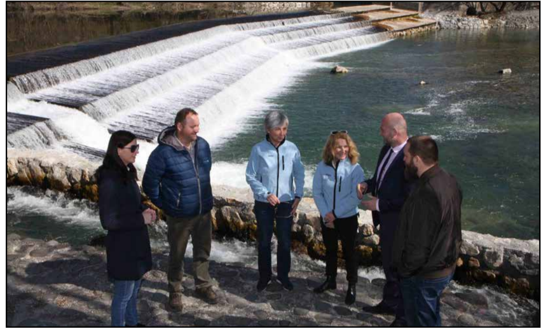
Z obnovljenega Podvinskega jezu na dan odprtih vrat