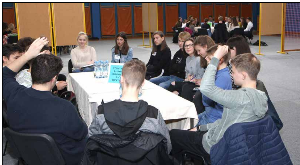
Z medobčinskega otroškega parlamenta na OŠ Braslovče