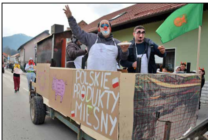
Meso iz poljskih klavnic tudi v naši dolini