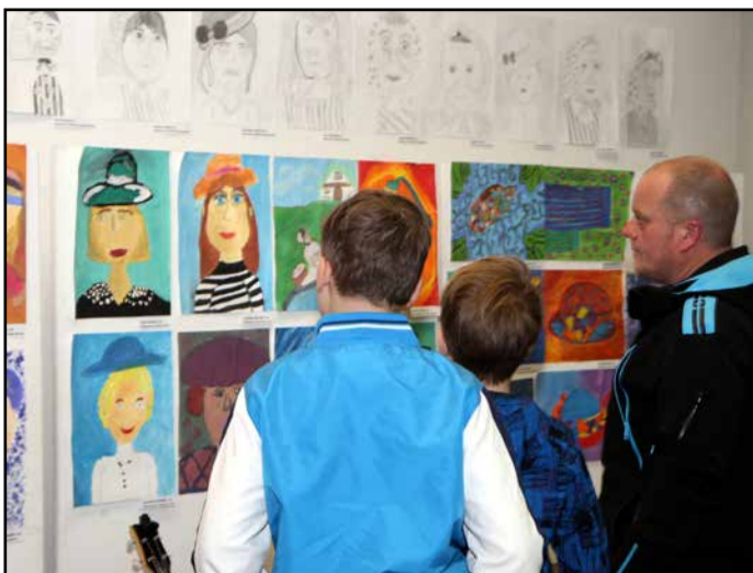
Z razstave Žena – mati na dan odprtja