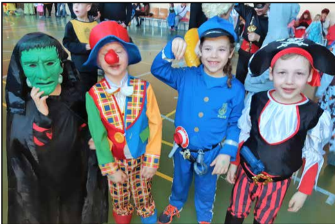
Maškare v Taboru

Veselo pustno rajanje so po tradiciji na pustno nedeljo popoldne pripravili tudi v Krajevni skupnosti Galicija. Vsa-