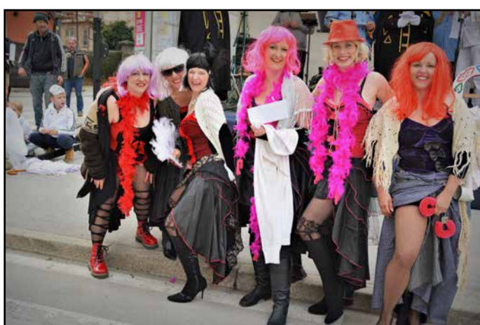
Brhka dekleta so očarala generale na Vrnskem.