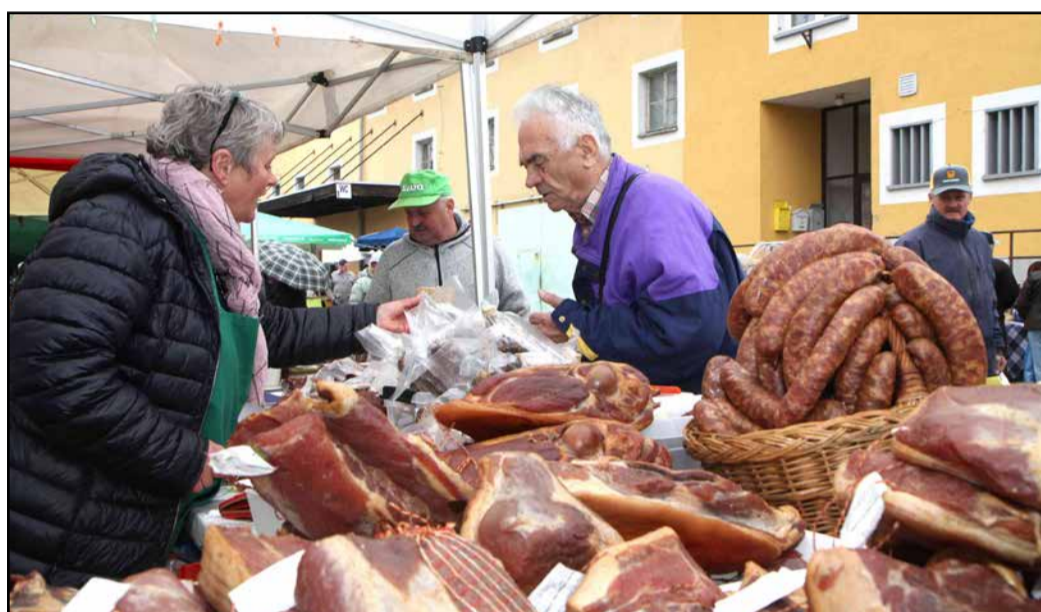
Domače dobrote so vabile s stojnic.

njen zunanji rob pa je gladek ali pokončno rebrast. Potresena je lahko s sladkorjem v prahu in kot taka predstavlja slovensko narodno sladico, na katero smo Slovenci zelo ponosni.