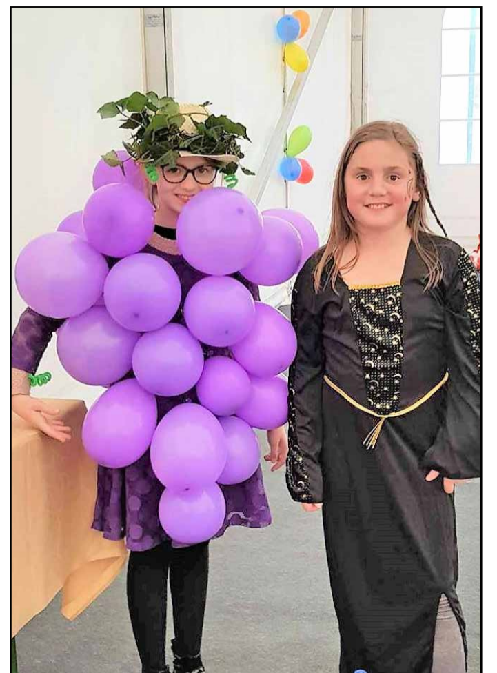
Na Pinikvi so za pusta celo obirali grozdje.