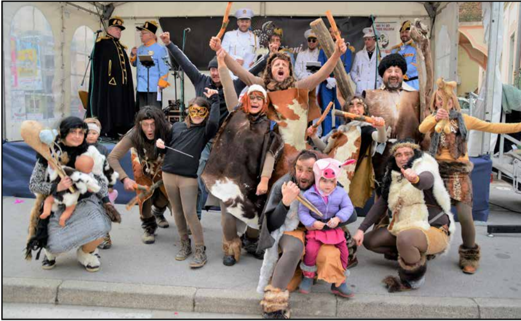
Na Vrnskem so zmagali praljudje.