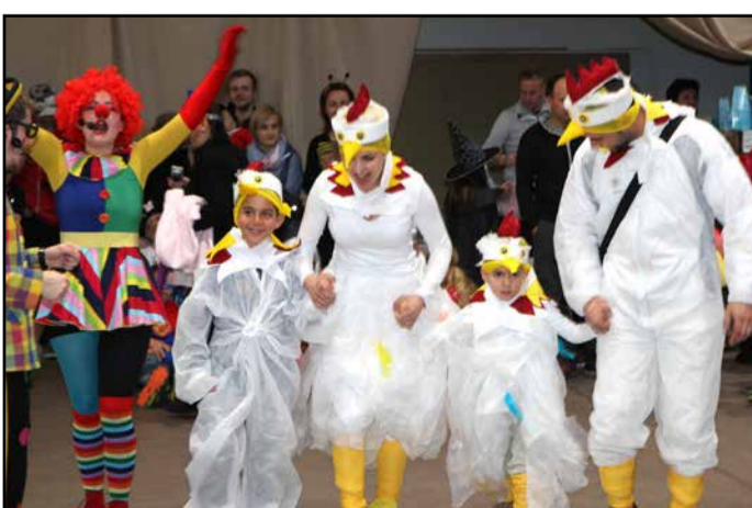
Razigrana kokošja družina na Polzeli