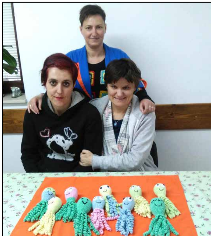
V VDC Muc s prvimi hobotnicami

»Trudile se bomo še naprej in tudi v tem letu poskušale s svojimi kvačkani izdelki razveseljati male junake,« pravijo uporabnice VDC Muc. T. T.