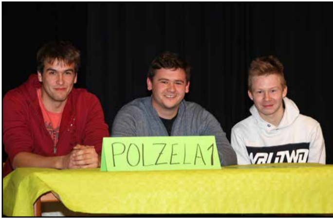
Prva ekipa DPD Polzela, zmagovalka kviza v Petrovčah