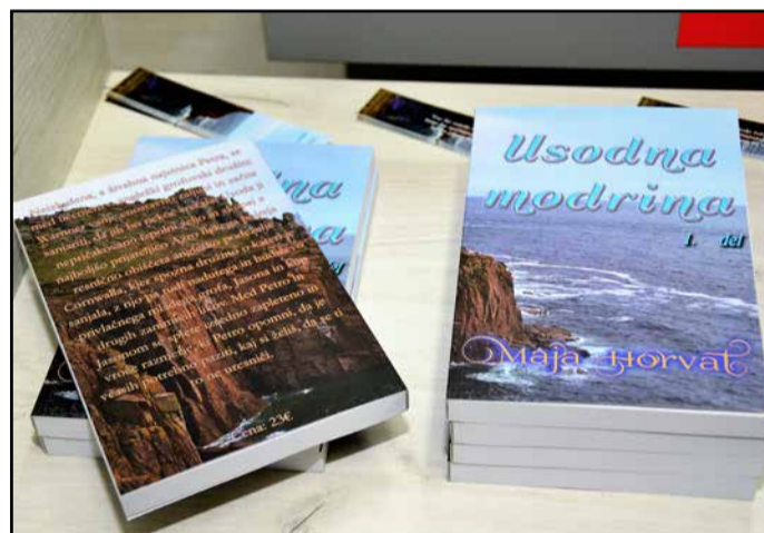
Roman Usodna Modrina, 1. del

sona ter kup drugih zanimivih likov. Med Petro in Jasonom se splete izjemno zapleteno in vroče razmerje, ki Petro opomni, da je včasih treba paziti, kaj si želiš, da se ti to ne uredi.