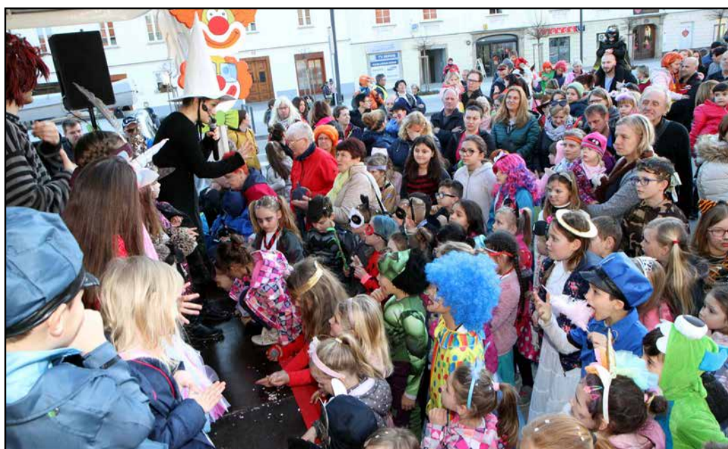
Otroške maske so napolnile Slandrov trg v Zalcu.