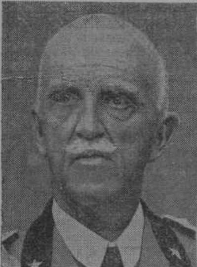
Italijanski kralj V. Emanuel je naslihan na novih abesinskih znamkah.