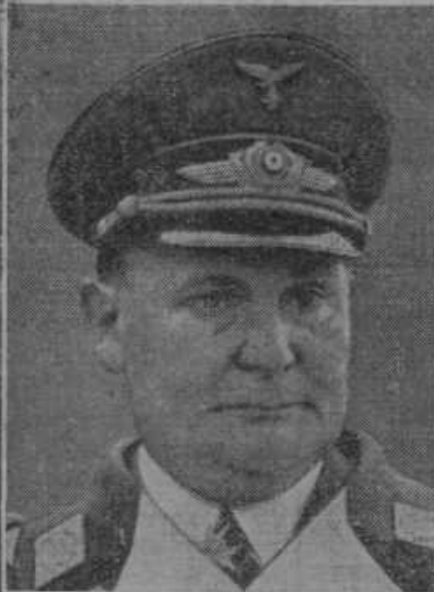
Pruski ministrski predsednik Göring se je mudil v Rimu.