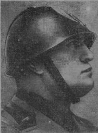
Mussolini je imel pogajanja s predstavnikom Nemčije Göringom.