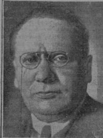
Komisar sovjetske Rusije za zunanje zadeve Litvinov zastopa sovjete na 49. zasedanju Sveta Zveze narodov v Ženevi.