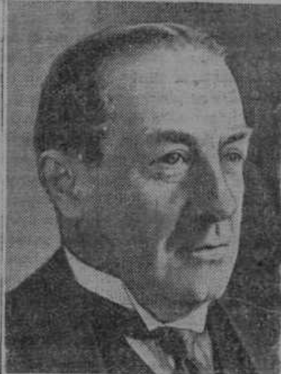
Predsednik angleške vlade Baldwin se je razgovarjal s predsednikom Irske o nadaljnjih odnošajih Angležev do Ircev.