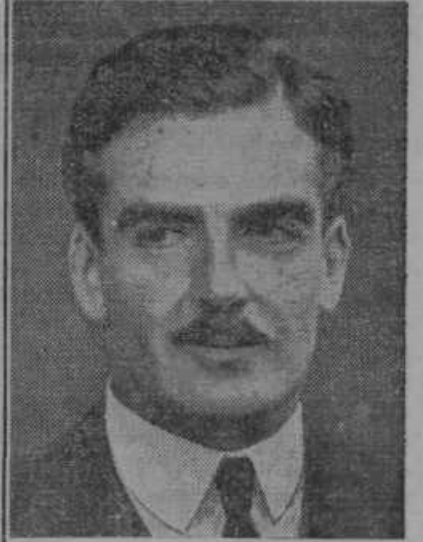
Angleški zun. min. Eden je podal v parlamentu izjavo proti boljševizmu.