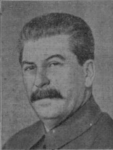
Diktator Rusije Stalin je izročil smrtni obsodbi 17 komunističnih voditeljev iz vrst Lenineve garde.