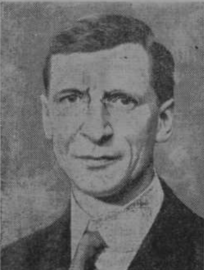
Predsednik Irske Valera se je pogajal zadnje dni z Angleži o prihodnjem razmerju Anglije do Irske.