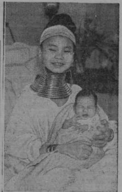
Sportistinja iz angleškega dela Indije iz Birme kaže Angležem v Londonu svoj s posebnimi obroči izredno visoko vzgojeni vrat.