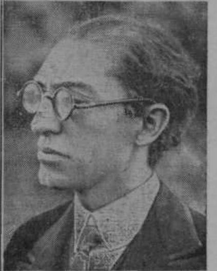
Turški zunanji minister Teftik Bey zastopa Turčijo na 49. zasedanju Sve-Zveze narodov v Ženevi.