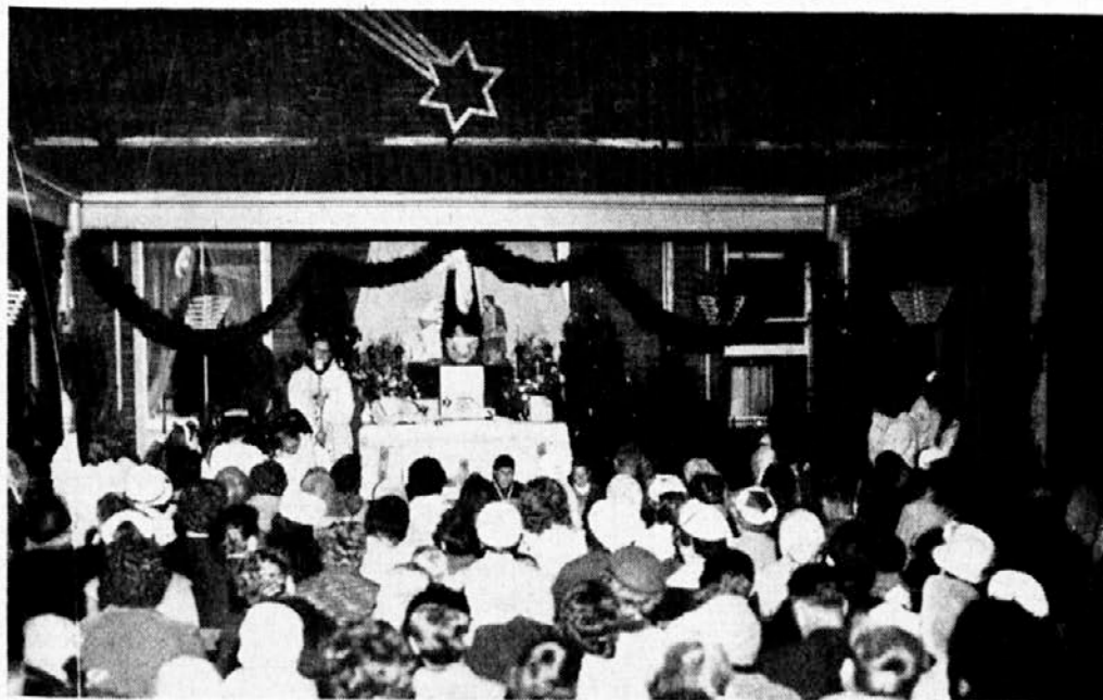
Pred oltarjem ob polnočnici v Melbourne