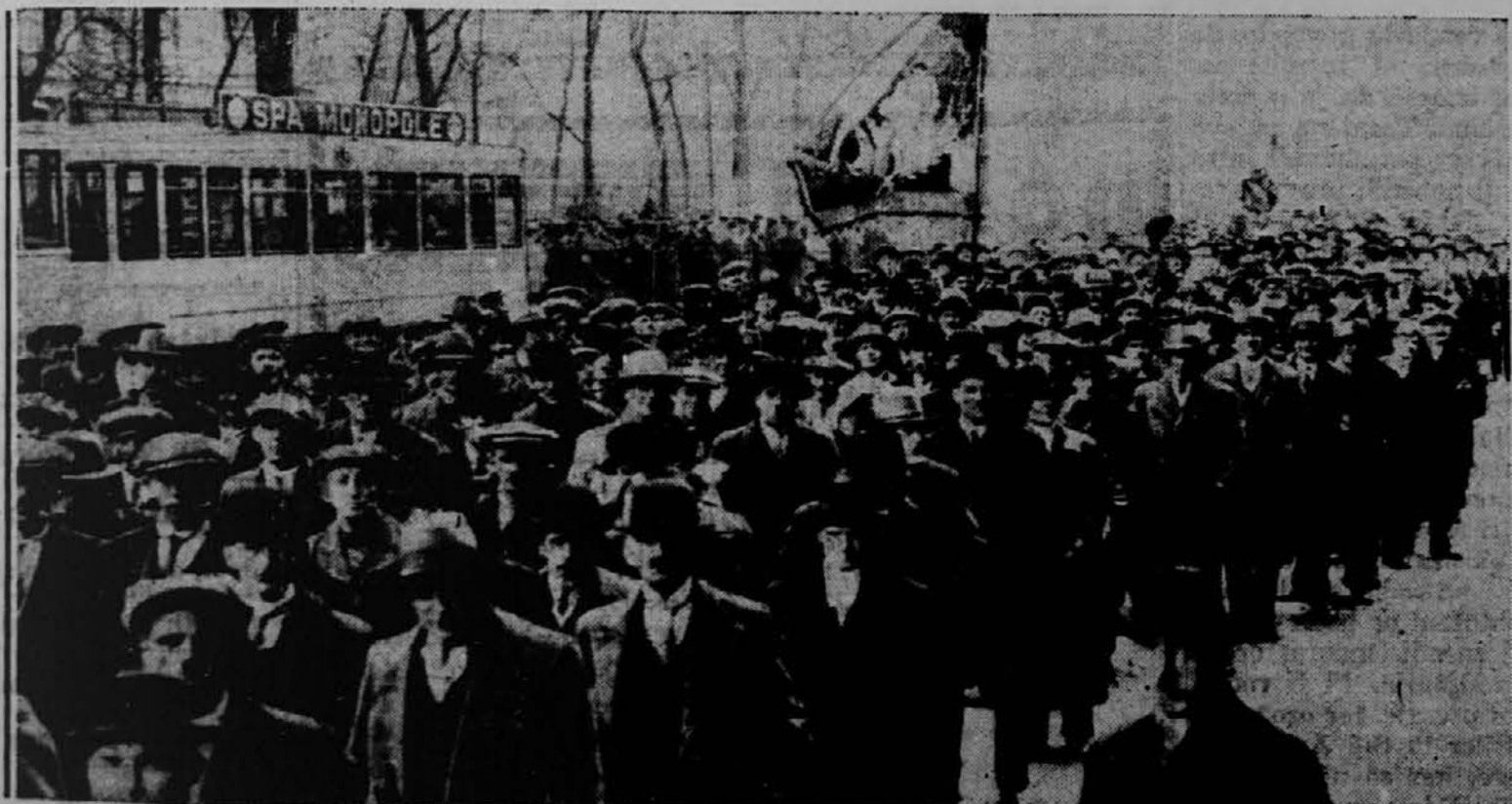
Na sliki vidite del protestne demonstracije, katere se je v Bruselju, Belgija, udeležilo nad osemdeset tisoč oseb. Demonstranti so protestirali proti neznosnim davkom, ki jih nalagajo državno in občinske oblasti. Policija ni imela posebnega opravka, ker so se ljudje mirno zadržali.