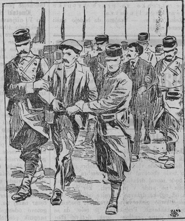
Zu den Teuerungskrawallen in Frankreich.

Quentin in drugih mestih je prišlo do pravcati bojov s policijo in vojaštvom. Mesarske prodajalne in pekarije je ljudstvo napadlo in oropalo ter jih potem zažgalo. Delavci so imeli s petrolejom napolnjene brizgalnice, s katerim so jedila polili; vplili so: ako nimamo mi za jesti, naj tudi drugi lakoto trpijo. Mnogo prodajalen in mesarij so tudi zažgali. Naša današnja slika kaže en prizor iz teh bojov in demonstracij. Na sliki vidimo namreč aretirane uporne delavce, ki jih vodijo vojniki v ječo. Ali kaj pomaga vse to! Vlade vseh držav naj bi pomislile, da je lakota hujša kakor vse postave in močnejša kakor vse ječe. Saj je končno tudi velika francoska revolucija nastala edino zaradi tega, ker so oduhruki žitje zbirali in na ta način kruh podražili. Skrajni čas bi bil, da se ljudstvu pomaga.