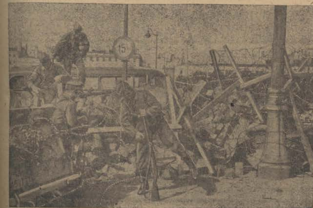
Von der Westfront

Največje priznanje je dal dr. Goebbels 185.000 pripadnikom Hitlerjeve mladine in 10.000 delavcem, ki so pomagali izkopati fortifikacije na zapadu. Fortifikacijska dela, izvedena ob stalni vpostavi življenja, so bistveno pripomogla k med tem izvedeni stabilizaciji fronte. V Führerjevem imenu se je zahvalil dr. Goebbels vsem kopačem na zapadu in vzhodu za svojo neumorno in hrabro vpostavo. Minister in zborovalci so se istočasno epomnili dostojno vseh tistih, ki so pri izpolnjevanju patriotske dolžnosti žrtvovali svoja