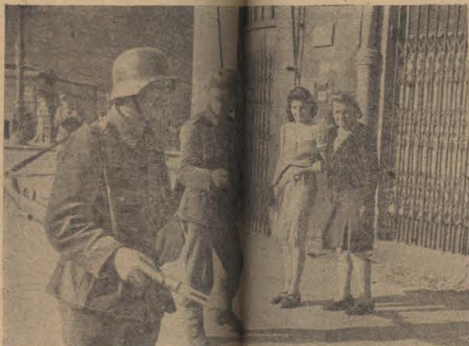
In Warschau und wieder Ruhe

Der von London und Moskau entfachte Aufstand ist unter den harten Schlägen der deutschen Wehrmacht zusammengebrochen. Die Rebellen sind verstreut, die Zivilbevölkerung hat ihre Kellerlöcher, die während der Kämpfe Schutz boten, verlassen und geht langsam Arbeit nach. Nur Wehrmachtstreifen in den Straßen an die zurückliegenden Kampfzonen