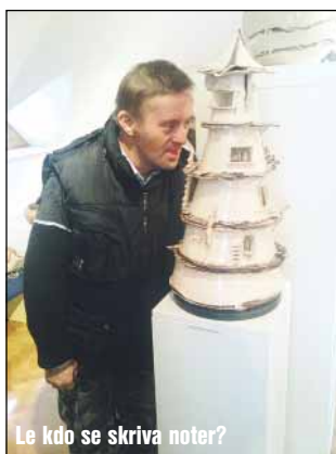
Le kdo se skriva noter?